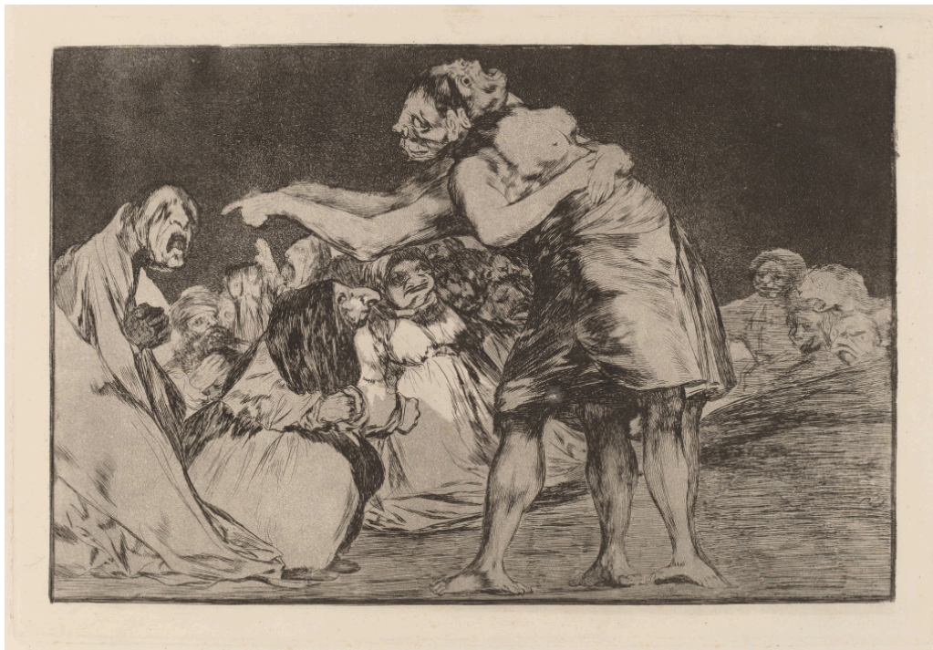
Figur 4 Francisco Goyas etsning Disparate desordenado (1815–23). «[Goya] vender seg mot en annen galskap. Ikke mot den som rammer de gale som kastes i fengsel, men som rammer det mennesket som er kastet ut i mørket» (1, s. 183).