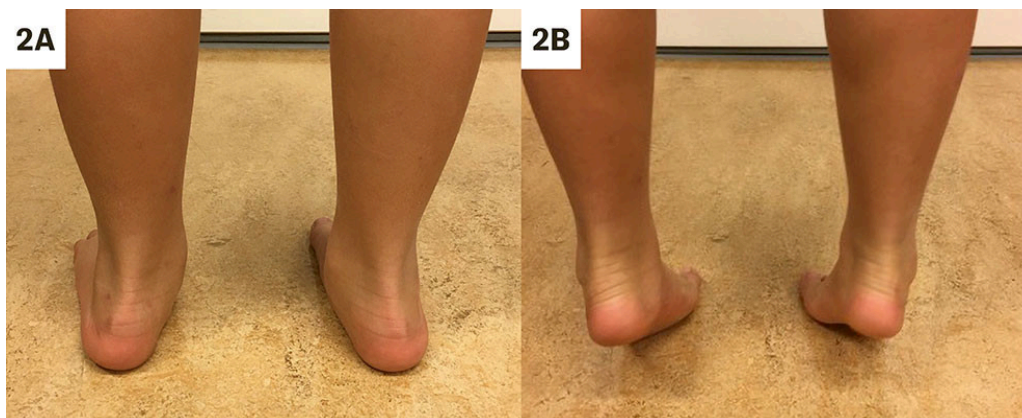
Figur 2 Barn med fleksibel plattfot demonstrer hvordan lengdebuen formes ved tågange ( heel-raise ), samtidig som hælene endrer seg fra valgus- til varusstilling.

Jacks test vurderer om lengdebuen gjenopprettes ved passiv dorsalfleksjon (ekstensjon) av stortåen, mens heel-raise -testen viser hvordan foten endrer form når pasienten står på tærne (1, 11) (figur 2). Ved fleksibel plattfot gjenopprettes lengdebuen, og hælen skifter fra valgus- til varusstilling. Ved stiv plattfot ser man ikke tilstrekkelig gjenopprettelse av lengdebuen eller endring av bakfotens stilling.