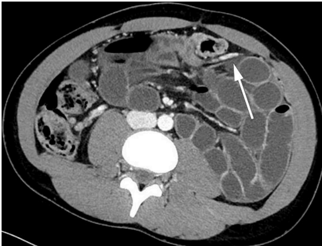
Figur 2 Aksiale snitt. Dilaterte ileumslynger i venstre fremre pararenale rom. Ascenderende gren av venstre arteria colica krysser fra dorsalt til ventralt sentralt i buken i nivå med den brå kalibervekslingen. Vena mesenterica inferior ligger ventralt for de hernierte tynntarmslyngene.

Behandlingen av paraduodenalt brokk er operasjon, enten laparoskopisk eller ved laparotomi, med mål om å reponere tynntarmen og lukke åpningen i mesenteriet (1). Det er ingen klare retningslinjer for operativ tilnærming og hvordan man tar hensyn til de store mesenterielle karene. Ved paraduodenalt brokk burde man ta hensyn til de mesenterielle karene som går ventralt og medialt for brokket, men hvis man deler disse strukturene, komprimerer ikke dette blodforsyningen til tarmen (6).