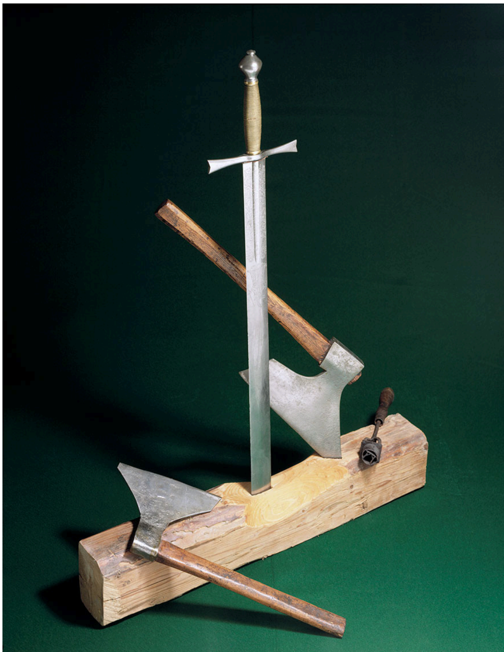
Figur 3 Skarpretterutstyr som har tilhørt familien Lædel.

«Hvis Lædel faktisk hadde bradykinesi, vil det kunne forklare at hvert hugg fikk mindre høyde og påfølgende mindre kraft»