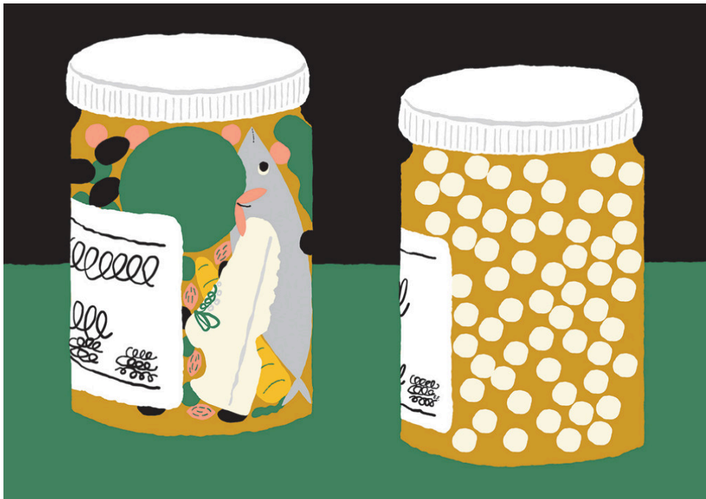
Illustrasjon: Espen Friberg

I de nye europeiske retningslinjene for forebygging av hjerte- og karsykdommer introduseres en trinnvis tiltaksmodell. Livsstiltak er basis. Bruk av medikamenter anbefales basert på en risikovurdering der man tar hensyn til pasientens skrøpelighet, komorbiditet og egne preferanser.