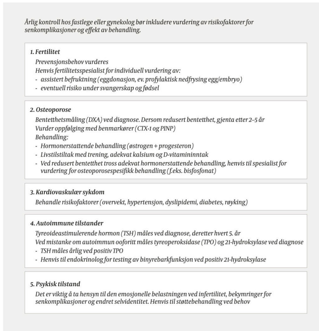
Figur 2 Oppfølging og behandling av prematur ovarialinsuffisiens (3).

mangler, og man bør tilstrebe så fysiologisk behandling som mulig frem til regulær menopausealder. I Norge er gjennomsnittsalderen for menopause 52,9 år ( \pm 2,1 år, spredning 40,3–58,7) (3). Til tross for klare råd om behandling, finnes det studier som tyder på underbehandling av tilstanden (12). Regelmessig oppfølging med tanke på optimalisering av substitusjonsbehandling, symptomlindring og identifisering av komplikasjoner er viktig (figur 2) (3).