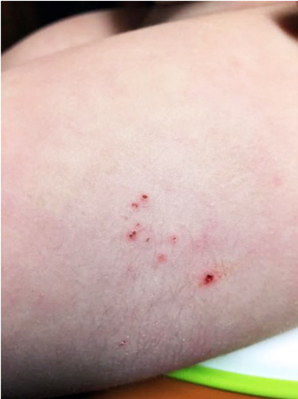
Figur 1 Pasientens laterale venstre lår med tydelig behåring og kronisk eksem.

En ultralydundersøkelse tre måneder etter at kulen ble oppdaget, viste en skarpt avgrenset, uregelmessig lobulær, multilokulær cystisk/aneikkoisk lesjon (ca. 3 \times 0,5 cm) i subkutant fettvev, uten affeksjon av muskelfascien. Differensialdiagnoser var organisert hematom, sekvele etter en fokal inflammatorisk prosess, vaskulær malformasjon eller annet (figur 2). Kontroller tre og ni måneder senere viste uendret lesjon. Radiologen anbefalte vurdering av barnelege.