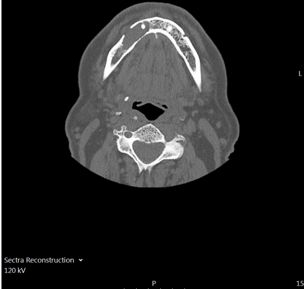
Figur 2 CT ansiktsskjelett. Aksialplan. Lytisk prosess i høyre mandibula med bløtdelskomponent som protruderer gjennom en utvidet foramen mentale.

Grunnet bekymring for mulig kreftsykdom ble pasienten henvist til et pakkeforløp ved øre-nese-hals-dagavdeling for diagnostisk avklaring. I mellomtiden oppsøkte pasienten tannlege, som fant normale ekstraorale, intraorale og periodontale forhold. Panoramarøntgen (OPG) viste en velavgrenset radiolusens apikalt om tann 44, som ga mistanke om apikal cyste. Tannlegen anbefalte at pasienten ble utredet videre på sykehus.