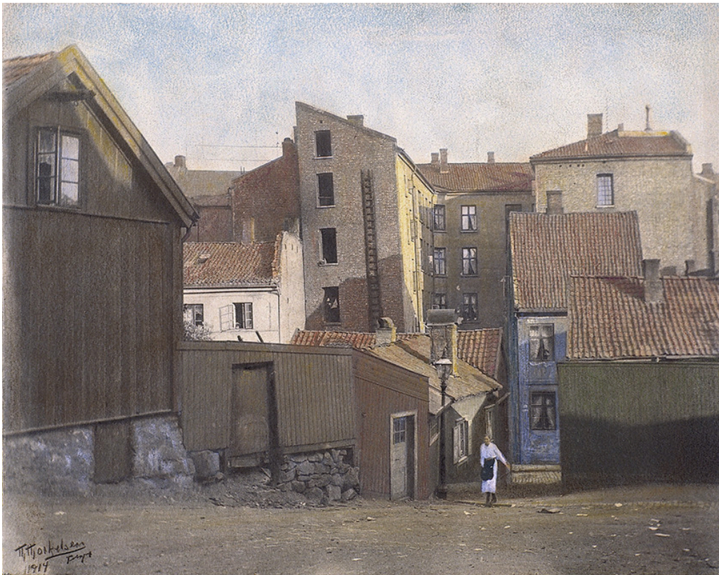
Figur 1 Forstaden Pipervika, hvor det var billig å bo, ble et vanlig sted å losjere for studentene på 1800-tallet. Dette fargelagte fotografiet viser Strandbakken, hvor Oslo Rådhus står i dag.