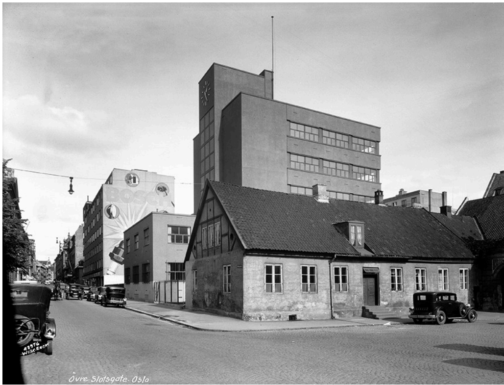
Figur 3 «Anatomigården» (Rådhusgaten 19), byens eldste bindingsverkshus, var i bruk for medisinsk undervisning fra oktober 1815 og til det nye universitetskomplekset på Karl Johan sto ferdig til innflytting i 1852. Tidligere kalt «Brennerigården» på grunn av et geneverbrenneri som holdt til her. Foto: Wilse / Oslo Museum (1935).

Det medisinske miljøet var som nevnt begrenset. Det gjaldt ikke minst tilgangen til lærebøker. Noen av forelesningsnotatene som er bevart fra denne første tiden (8), viser hvor nøye studenten måtte skrive ned alt for å sikre seg stoff til de obligatoriske fagene som ble forelest: encyklopedi, medisins historie, anatomi og fysiologi, diettlære, patologi og terapi, farmakologi og reseptlære, kirurgi og fødselsvitenskap, rettsmedisin og «Sundhedspolitie», som nærmest kan oversettes med hygiene (9). Noen egentlig studieplan fantes ikke, og klinisk undervisning ble først mulig etter at Rikshospitalet åpnet i 1826 (10).