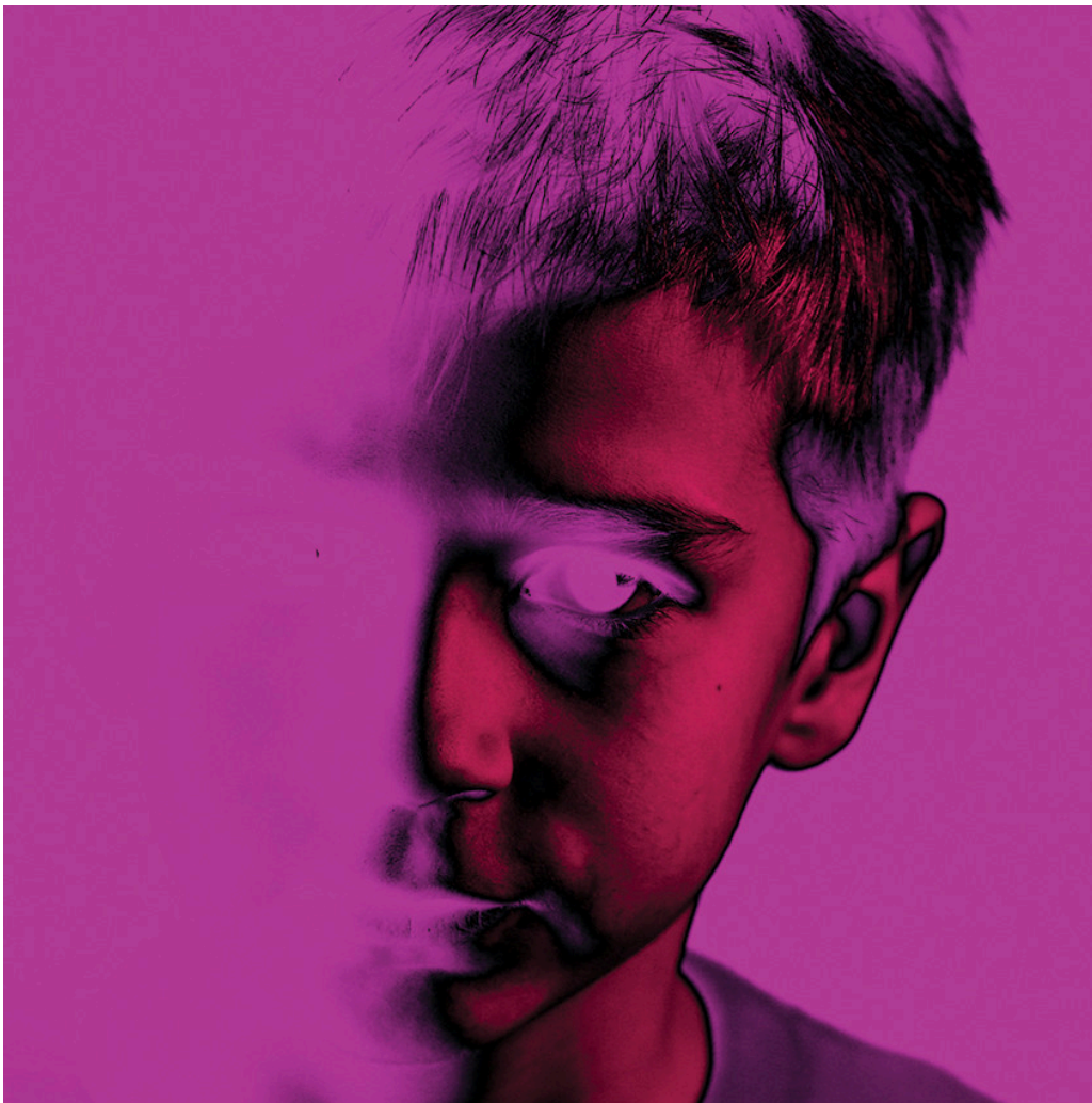
Tilpasset av Tidsskriftet.