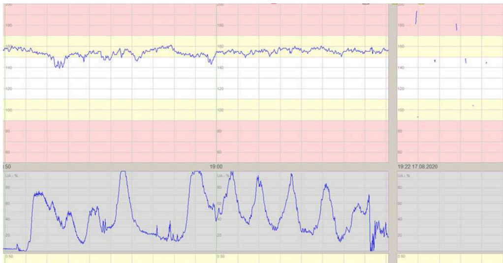
Figur 1 Kardiotokografi (CTG) viser fosterets hjerterefrekvens (øverste kurve), som ligger over normalområdet (det hvite feltet). Rieregistreringen (nederste kurve) viser hyppige rier før CTG-apparatet ble koblet av. Etter påkobling 13 minutter senere hørte jordmor en hjerterefrekvens mellom 70 og 90 slag per minutt hos fosteret, og man ser ingen rier på rieregistreringen.

Ved laparotomi tømte det seg koagler og blodtilblandet væske fra bukhulen. Det ble utført uterotomi på vanlig måte. Fostervannet var blakket. Det ble forløst et blekt, slapt barn fra hodeleie. Ved forløsning av placenta ble denne funnet i fri bukhule, og det ble palpert tarm i uterinhulen samt en 12 cm lang uterusruptur som strakk seg fra høyre til venstre tubehjørne langs hele fundus uteri (figur 2).