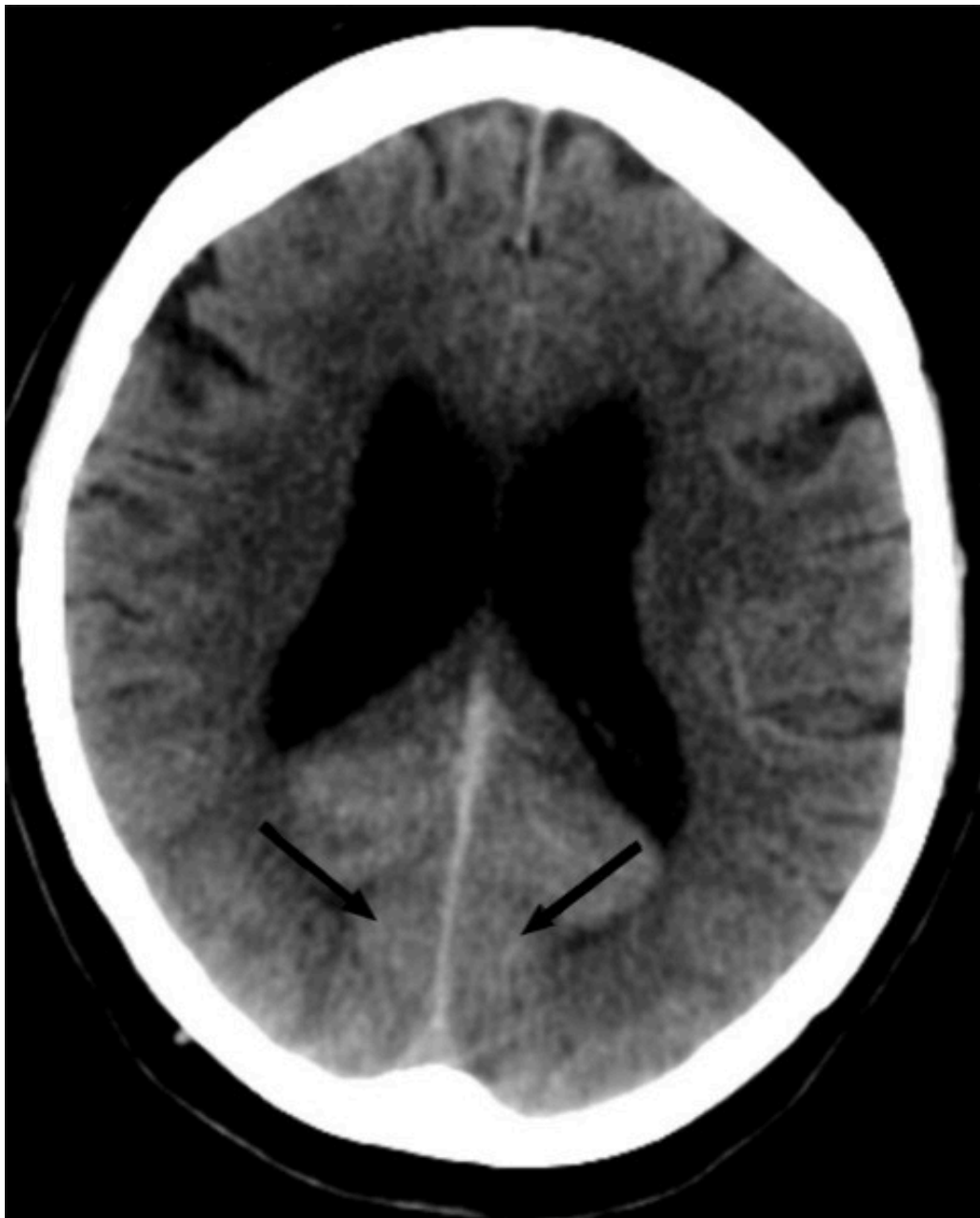
Figur 1 CT caput viser diffus utbredt kontrastretensjon oksipitalt bilateralt, inkludert i synsbarken. Ingen blødning eller infarkt.

MR caput (T1- og T2-vektede sekvenser, FLAIR-sekvenser og diffusjon med ADC-verdier (apparent diffusion coefficient)) utført rett etter CT-undersøkelsen viste som tidligere uspesifikke T2- høysignal lesjoner, men ingen nytilkomne forandringer (figur 2). Det var ingen diffusjonsrestriksjon, som er forventet ved ferskt hjerneinfarkt (3).