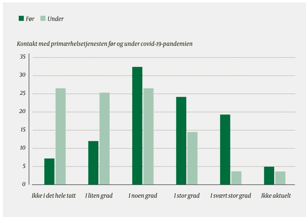
Figur 2 Behandlers rapportering av kontakt med primærhelsetjeneste før og under covid-19-pandemien.

pasientene hadde fått mer oppfølging av primærhelsetjenesten i denne situasjonen, svarte over halvparten at det hadde skjedd i liten grad (42,2 %) eller ingen grad (14,5 %). Kontakten mellom spesialisthelsetjenesten og primærhelsetjenesten ble vurdert som lavere under pandemiperioden, fra at 43,4 % hadde kontakt i stor eller svært stor grad til 18,1 % under pandemiperioden (figur 2).