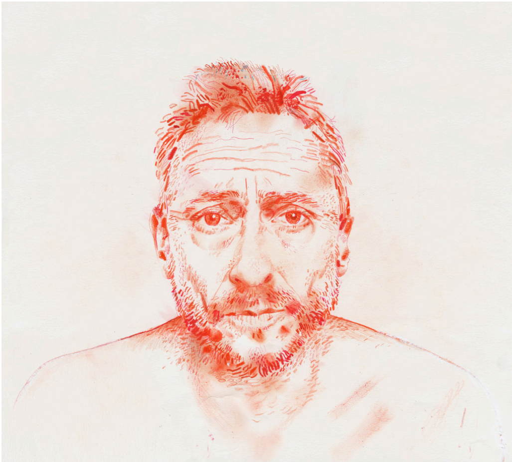
Illustrasjon: Derek Bacon Unplugged / NTB

Abramović forteller i sin biografi at hun erfarte umiddelbart at menneskene som satt mot henne, ble sterkt beveget, og hun opplevde en tilknytning til hver person ((7), s. 308–21). Følelsen av gjensidig ubetinget kjærlighet overfor fremmede var noe av det mest utrolige hun noensinne hadde opplevd.