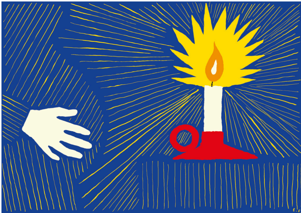
Illustrasjon: Espen Friberg

Valproat kom på markedet i Frankrike i 1967. Det er et av de mest effektive medikamentene for generalisert epilepsi, bipolar lidelse og migrene. Ettersom dette er hyppige sykdommer hos fertile kvinner, har valproat vært det tredje mest brukte antiepileptikum under graviditeten i Norden de siste 10–20 årene.