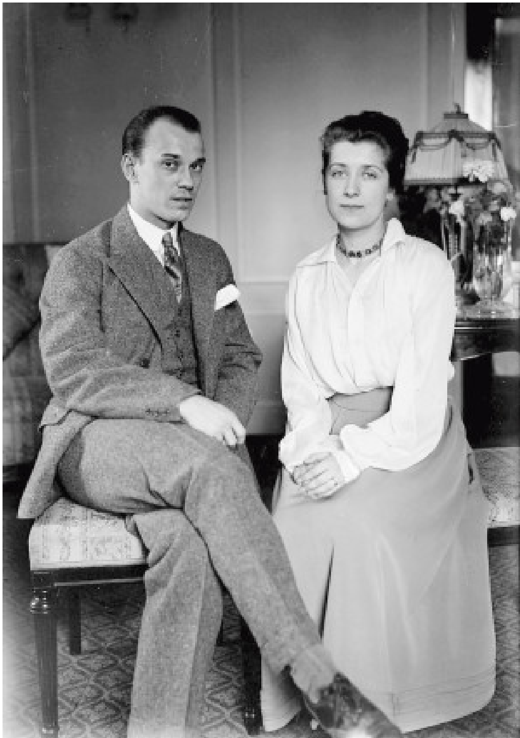
Nijinsky og kona Romola de Pulszky i 1916.

De første månedene der var Nijinsky gjentatte ganger voldelig, snakket ikke, var i ubevegelige stillinger, blottet seg, hørte stemmer og hadde vrangforestillinger. Han fikk diagnosen psykogen katatoni. Kona la seg stadig opp i behandlingen, og etter en tid tok hun han hjem for å pleie han selv. Da han ble gjeninnlagt fire måneder senere, var han klart forverret, med vekslende mellom stillstand og frenetiske bevegelser, plutselig vold, hallusinasjoner, vrangforestillinger og dårlig hygiene.