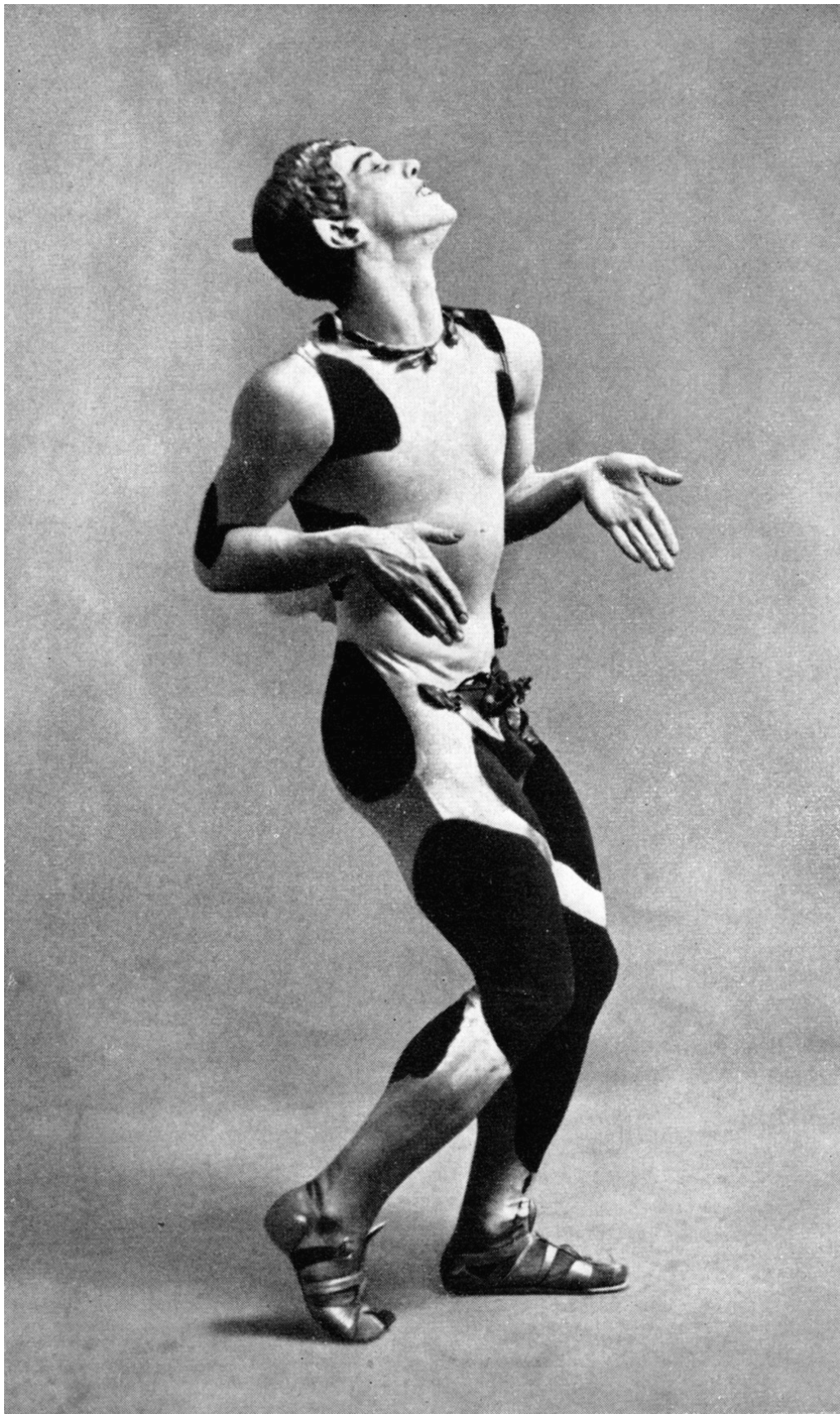
Nijinsky koreograferte og danset hovedrollen i Faunens ettermiddag i 1912, til musikk av Claude Debussy og dekor av Leo Bakst.

En annen synsvinkel er at han kan ha hatt en autismspekterforstyrrelse, sett ut ifra diagnosekriteriene i DSM-5 (13): Han snakket lite, manglet sosial intelligens, var passiv i relasjoner og hans eneste altoppslukende interesse var