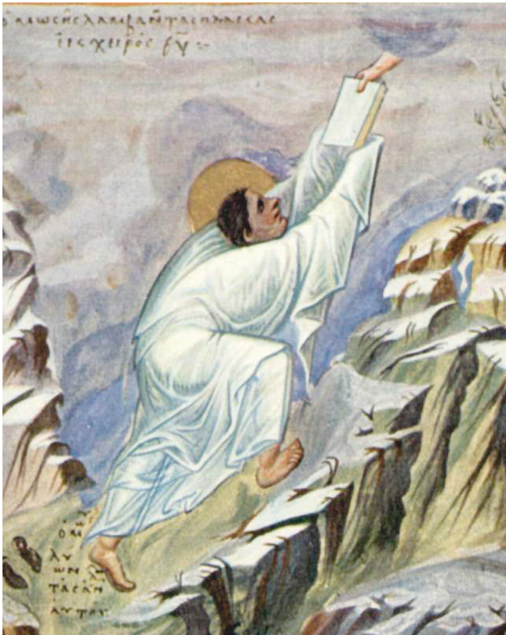
Figur 4 Moses mottar tavlene med de ti bud på Sinai, med hendene tildekket. Bysantinsk bibelillustrasjon fra 900-tallet. Illustrasjon: The Yorck Project / Wikimedia

Hånden var en naturlig del av edsavleggelsen, enten det var med tre fingre – tommel, peke- og langfinger – utstrakt på den løftede hånden eller det var med hånden plassert på hjertet. Speiderbevegelsens variant lar tommel- og lillefingeren danne en ring rundt de øvrige rette fingrene. De skal symbolisere det tredobbelte speiderløftet, mens ringen er et tegn på samhold (11) .