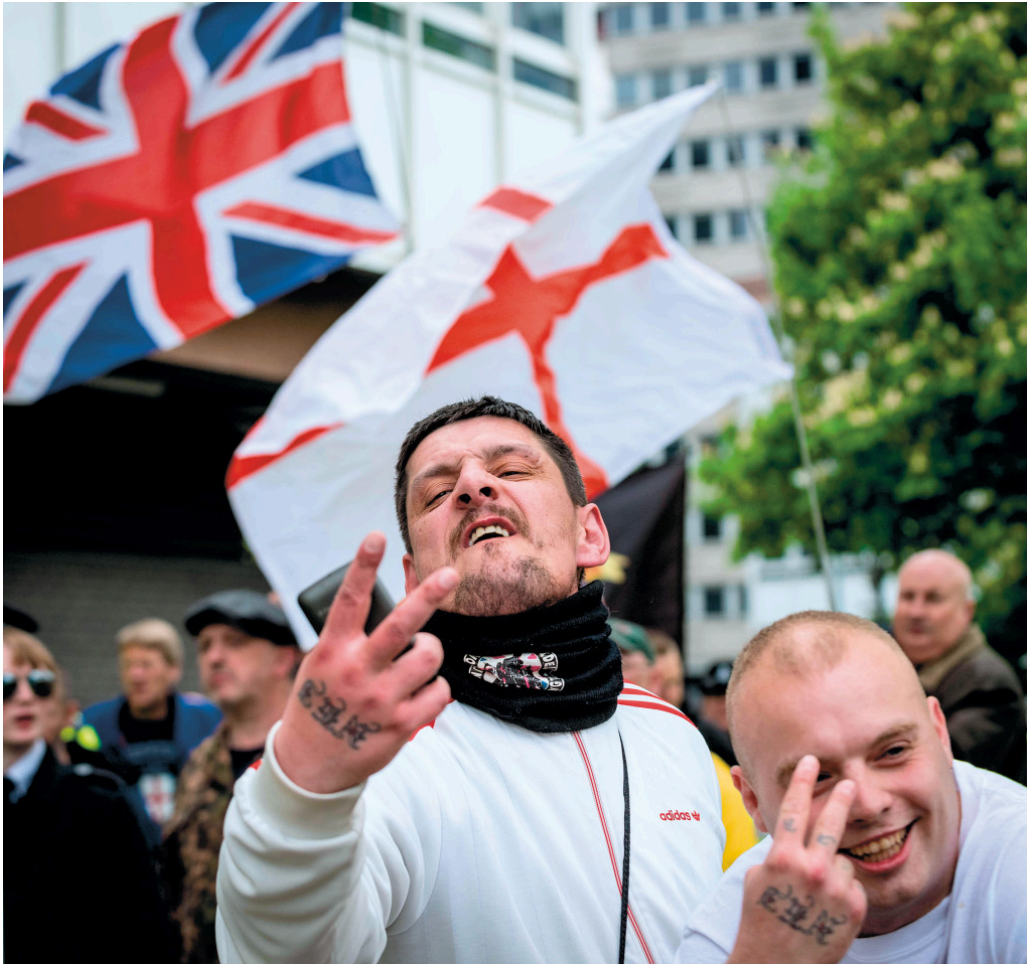
Figur 6 Her vises V-tegnet som en åpenbar protest under en høyreekstrem marsj i London i 2017.

Å gjøre V-tegn med peke- og langfingeren og håndflaten frem forbinder man med den annen verdenskrig og Winston Churchill (1874–1965). Fortsatt brukes dette, i tide og utide, som tegn på seier. Opprinnelig var det et hånlige protestuttrykk blant Englands arbeiderbefolkning – men da med håndbaken frem (13). I visse kretser brukes det fortsatt i sin opprinnelige form (figur 6).