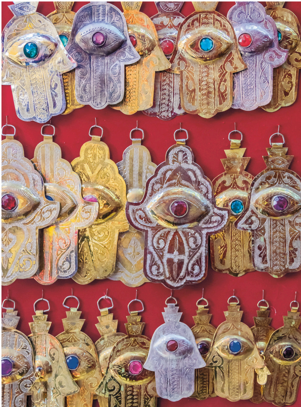
Figur 5 Fatimas hånd som amulettsmykker.

«I flere århundrer var hånden et kongelig symbol, og i Midtøsten er hånd fremdeles synonymt med makt»