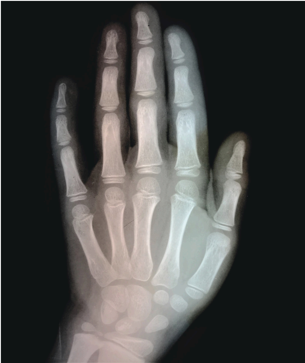
Figur 1 Røntgenbilde av hånden til en niåring.

Anatomien lærer oss at tommelen bare har to falanger – en grunnfalang og en ytterfalang – i motsetning til de andre fingrenes tre falanger. Men er det egentlig riktig? Ser vi på et røntgenbilde av en barnehånd, finner vi at falangene bare har én epifyseskive som sitter proksimalt, mens mellomhåndsknokenes ene epifyseskive sitter distalt. Røntgenbildet avslører imidlertid at tommelfingerens epifyseskiver alle sitter proksimalt (figur 1), både på falangene og på mellomhåndsbenet. Følgelig har den tre falanger som de andre fingrene, men mangler mellomhåndsknokkel. Denne kan gjenfinnes som et rudiment i håndroten hos primatene.