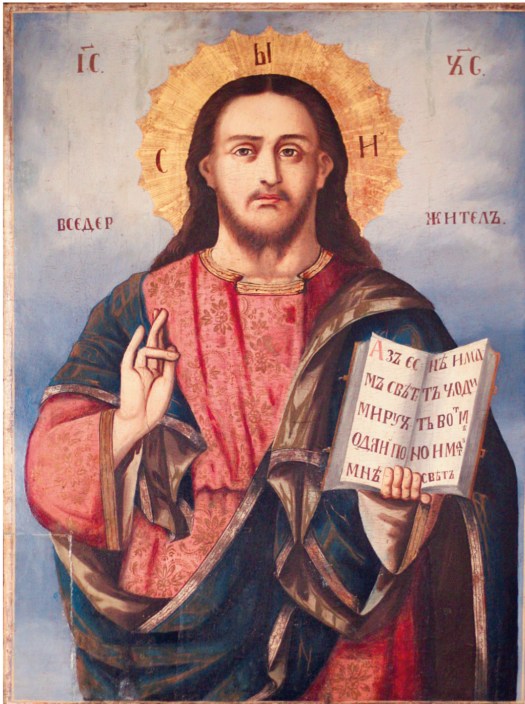
Figur 7 Russisk ikon som viser Jesus med den tradisjonelle håndstillingen: tommel mot ringfinger. Dette uttrykker amen . Bilde fra Haskovo Historic Museum i Bulgaria.

Ringfingeren, digitus anularis , har lange tradisjoner som såkalt helbredende finger. Derfor ble den også kalt digitus medicus . I antikken mente man at det var en slags forbindelse mellom ringfingeren og hjertet, og den kunne dermed ikke berøre noe giftig uten at hjertet fikk beskjed om det (4). Dens renhet gjorde den egnet til medisinsk bruk, og i terapeutisk henseende var det fornuftig å smøre på salver med ringfingeren. Eldre bilder av Jesus viser hans velsignende hånd der ringfingeren og tommelen berører hverandre som en sirkel, symbolet på amen (figur 7).