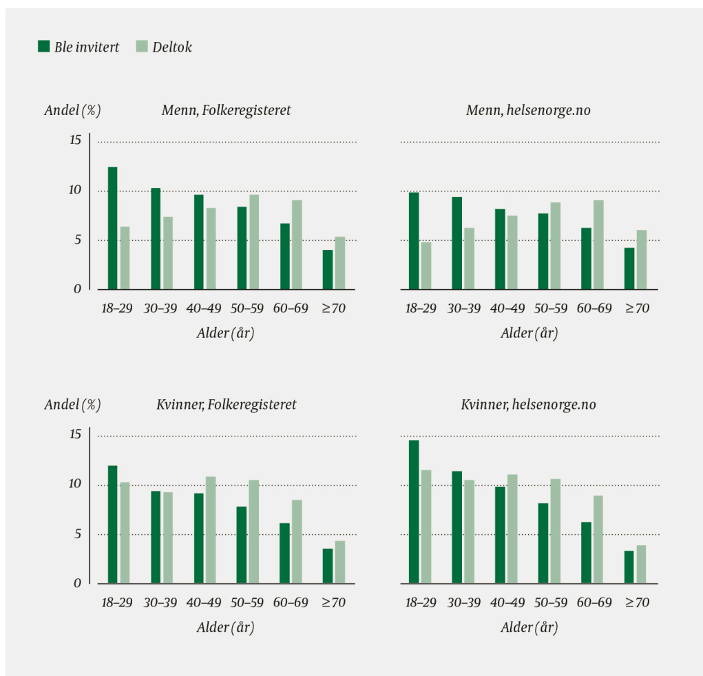
Figur 3 Alders- og kjønnsfordeling i to utvalg, trukket fra henholdsvis Folkeregisteret og helsenorge.no, fra Folkehelseundersøkelsen i Hordaland 2018. Inviterte og deltakere.

Figur 1 viser andelen som skårte høyt på psykiske vansker, gruppert etter utdanning. Blant de som bare hadde grunnskoleutdanning, var forskjellen mellom utvalgene nokså stor. Analysen av dataene fra helsenorge.no viser en langt sterkere sammenheng mellom utdanningsnivå og psykiske vansker enn det vi finner i dataene fra Folkeregisteret.