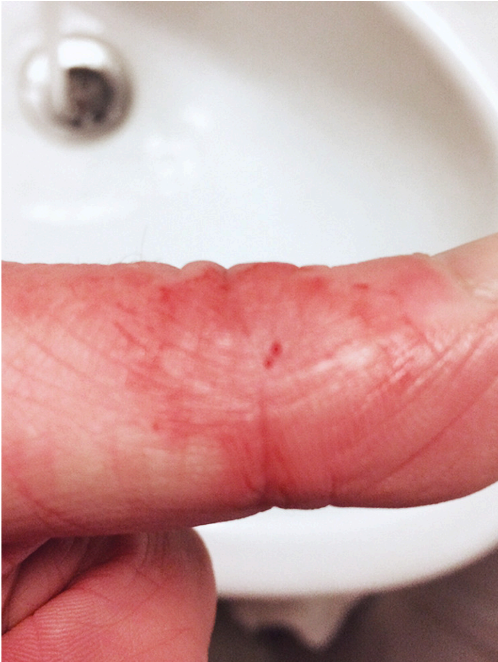
Figur 1 Reaksjon rundt stikkstedet etter et arbeidsuhell under vaksinerings av fisk.

det kunne være erysipelas og forskrev antibiotika og sykmeldte ham. De synlige reaksjonene forsvant i løpet av ca. 14 dager. Imidlertid fikk han langvarige plager med smerter og nedsatt kraft i hånden og periodevis nummenhet i fingrene. Han var sykmeldt i lang tid.