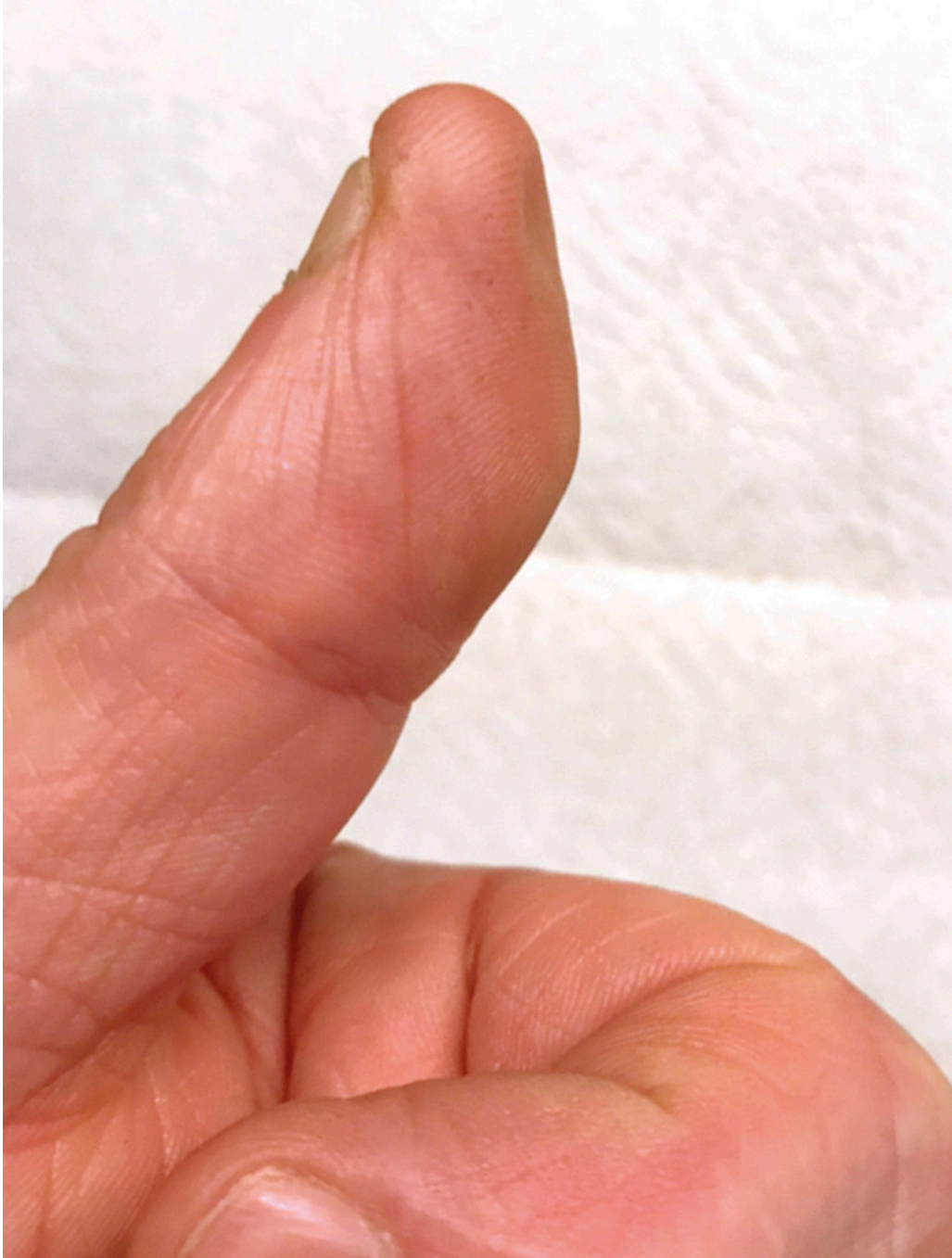
Figur 2 Atrofiert pulpa ca. ti måneder etter stikkskade i tommelen under vaksineringsarbeid.

Han ble gradvis bedre i tiden som fulgte. Om lag et halvt år etter uhellet begynte han i jobb igjen, men utførte da bare automatisk vaksineringsarbeid. Ved ny undersøkelse etter ca. ni måneder fant man god bevegelighet i håndledd og fingerledd og ingen tegn til hevelser. Kraften i håndtrykket var noe bedret. Ytterligere en måned senere tok han på ny kontakt fordi venstre tommel hadde endret seg. Det viste seg at pulpa på fingertuppen hadde atrofiert (figur 2).