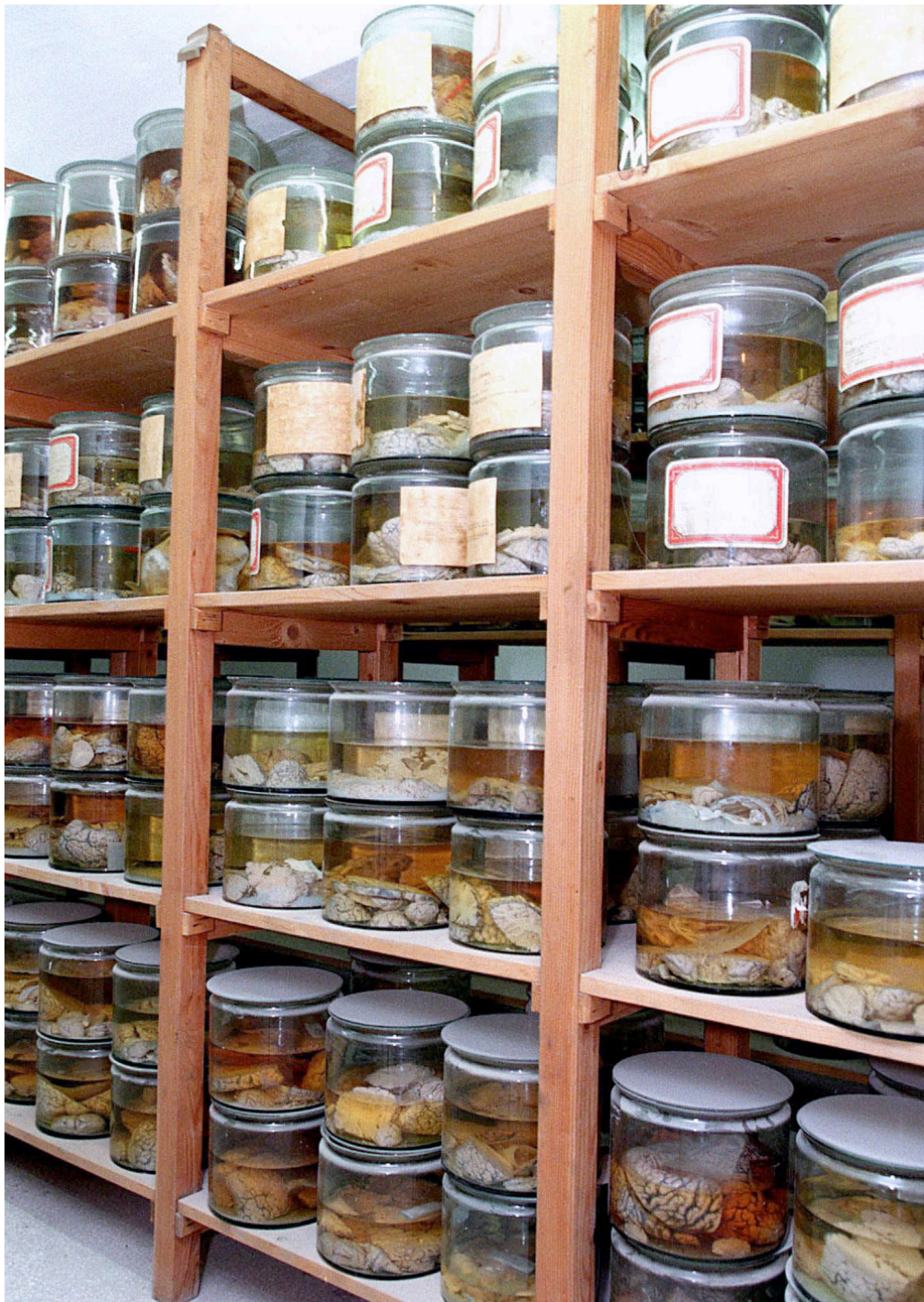
Noen av hundrevis av bevarte hjerner fra barn med fysiske eller psykiske funksjonsnedsettelse som ble drept i nazistenes eutanasi-program.

Den biomedisinske kunnskapen omfatter biologi, kropp, vev og anatomiske strukturer, og i mindre grad kunnskap om det syke mennesket som et føleende, tenkende og erfarende subjekt. For å behandle må en lege ha et betydelig fokus på sykdommens årsaker og kanskje i mindre grad på den sykes opplevelse som pasient. En lege helbreder mange ganger gjennom å skade og gjennomfører undersøkelser som er invasive og som kan være smertefulle. Det stikkes og skjæres, hud og slimhinner blottlegges, det kuttes i hudnerver og skrur i ben. Alt dette for å hjelpe. Samtidig må legen trøste den sørgende, informere den som er engstelig og bringe de mest alvorlige budskap til pasient og familie med empati og omtanke.