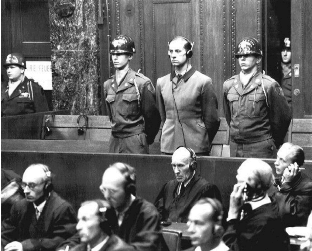
Karl Brandt, Adolf Hitlers da 43 år gamle livlege, ble dømt til døden ved hengning i Nürnbergprosessen.

utrydning ved gass kombinert med fysisk og ideologisk avhumanisering av ofrene. Distansering ble særlig nødvendig da man etter hvert skulle utføre massedrap også på kvinner og barn i alle aldre (3, 5).