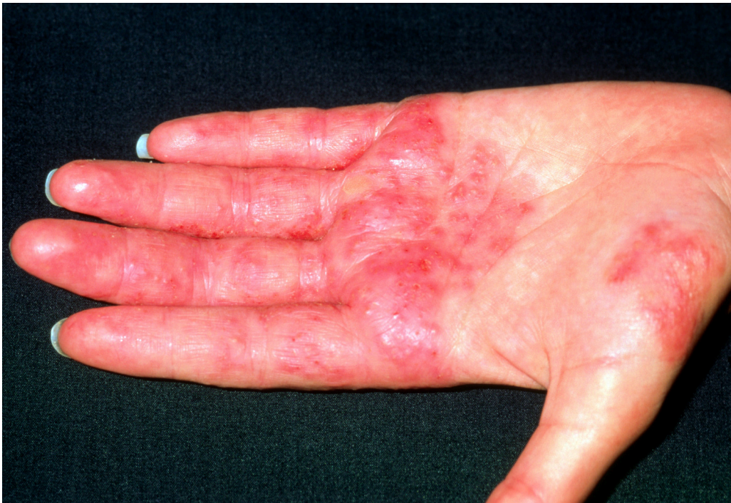
Figur 2 Eksempel på kontakteksem hos en frisør.

Allergisk håndeksem skyldes hudkontakt med et stoff som igangsetter en immunologisk reaksjon. Den vanligste reaksjonen er en cellemediert, immunologisk reaksjon (type IV-reaksjon). Hyppig forekommende yrkesallergener er hårfargemidler, konserveringsmidler, metaller, gummi, formaldehyd, epoksy, akrylater og isocyanater (11). Eksempler på de mest utsatte yrkesgruppene er frisører, mekanikere, sveisere og tannleger (11) (figur 2).