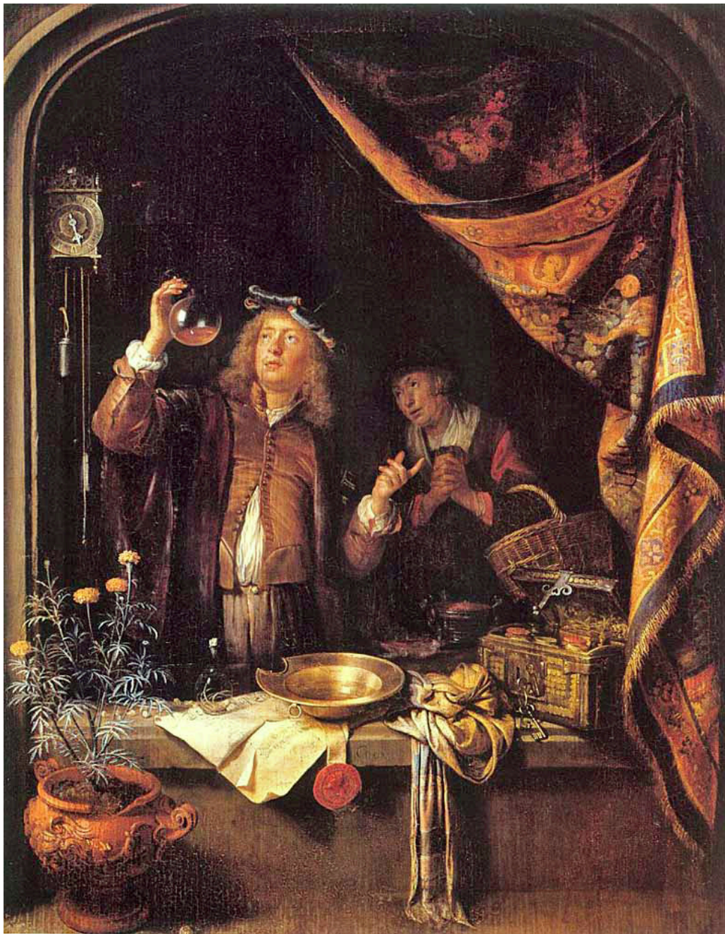
Figur 3 Gerrit Dou (1613–1675). «En lege studerer urin».