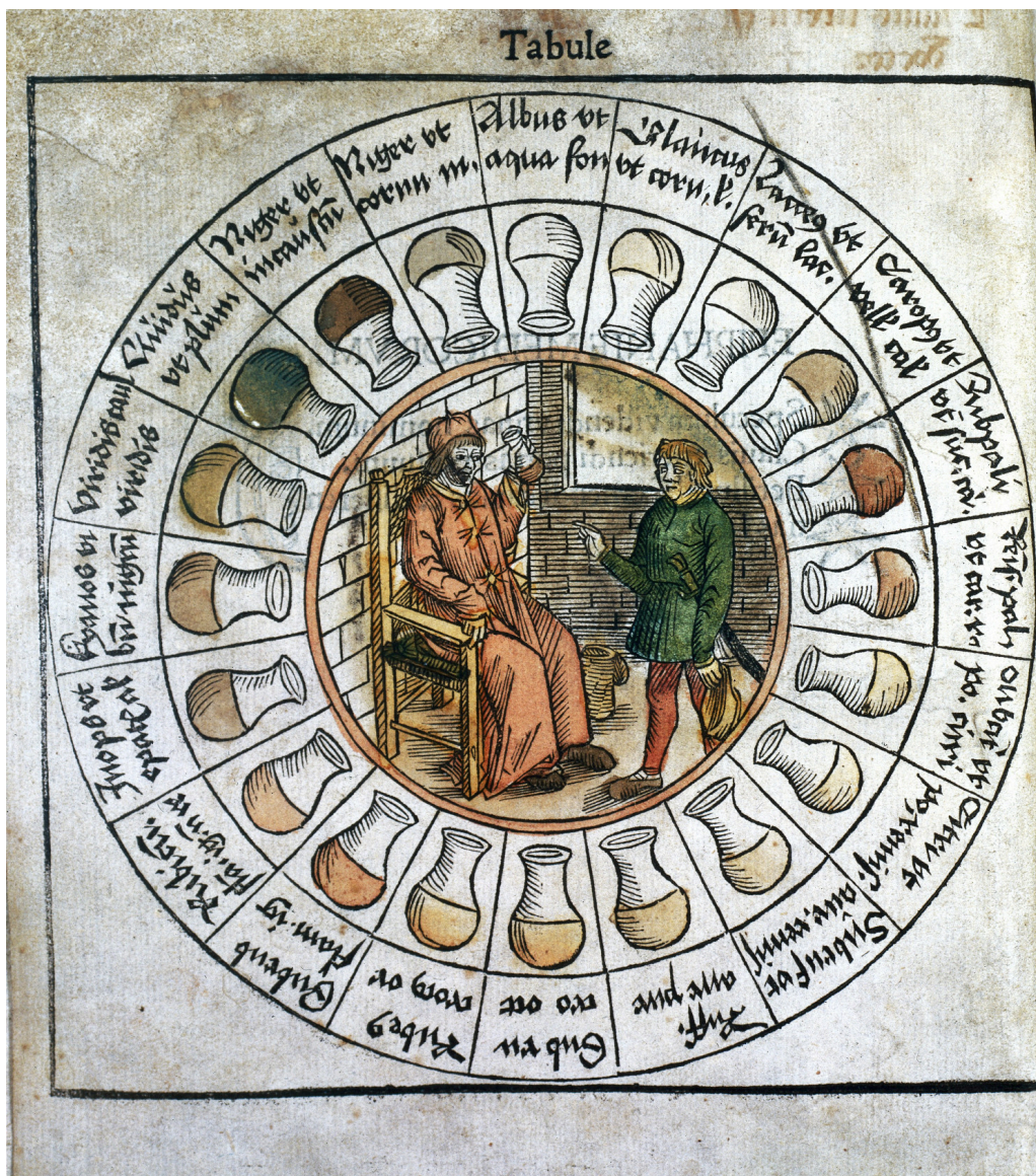
Figur 2 Det såkalte urinhjulet, med en fargeskala som får en til å tenke på moderne urinstiks.

Etter hvert fikk uroskopian status som legenes viktigste diagnostiske redskap, noe som representerte et brudd med den antikke tradisjonen, hvor anamnesen og klinisk undersøkelse var viktigere. Uroskopi ble selve innbegrepet av medisinsk praksis, og matulaen ble det ikoniske kjennetegnet på legen, omtrent som stetoskopet i våre dager. I tallrike kunstverk fra 1500- og 1600-tallet er legen avbildet mens han tankefullt studerer dette symbolsk viktige instrumentet (fig 3) (17).