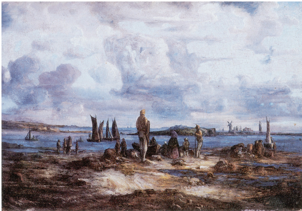
Figur 3 Lars Hertervig: Vårsildfiske. 1860-årene. Eies av Nasjonalgalleriet, Oslo

Hertervig frembrakte kunst av høyeste klasse, til tross for sin sykdom. Man kan vel kanskje tilføye: muligens, til tross for sin sykdom. Man kan vel kanskje tilføye: muligens også på grunn av sin sykdom. I sin isolasjon har han kanskje levd sterkere og mer intenst i sin indre verden. Stemninger har kanskje vært brutt som har fått ham til å se og oppleve en verden de fleste av oss bare får et glimt av. Kanskje har sykdommen, i hvert fall i den mer produktive fase, beriket hans kunst?