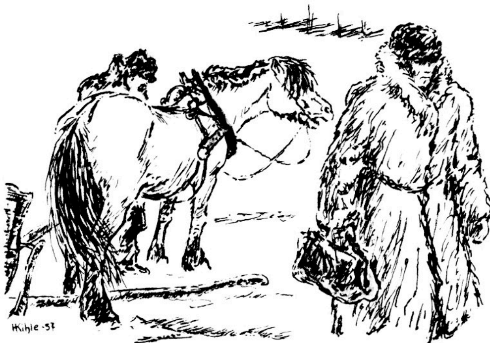
Figur 1 Vesleblakken og doktoren. Illustrasjon Harald Kihle (1905–97) fra 1957. Figur fra Thorbjørn Egners lesebok (4, side 155). Illustrasjon © Harald Kihle/BONO

Mange kjenner historien. Den gikk igjen i lesebøkene til både Nordahl Rolfsen (1848–1928) og Thorbjørn Egner (1912–90) gjennom nesten hele 1900-tallet (fig 1) (3–5). Slik ble fortellingen en del av den norske litterære kanon. Utdraget ovenfor er hentet fra Egners bearbejdede versjon (4). Siden er den falt ut av lesebøkene, og for dagens oppvoksende slekt er historien om Vesleblakken mindre kjent.