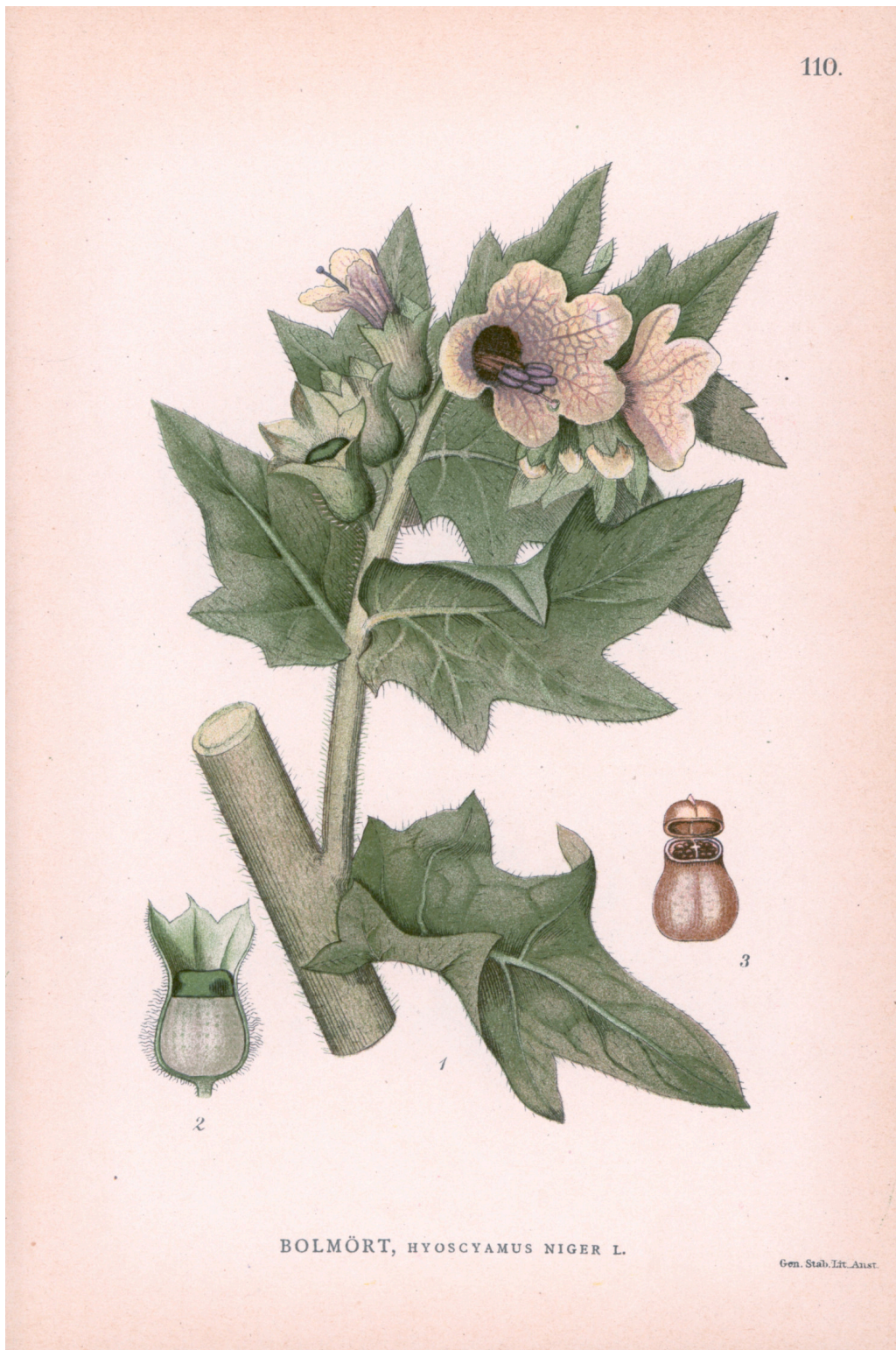
Bulmeurt, Hyoscyamus niger . Kromolitografi fra professor Carl Lindmans «Bilder ur Nordens Flora» fra 1905, hentet fra Johan Wilhelm Palmstruchs «Svensk botanik» (1802–43).