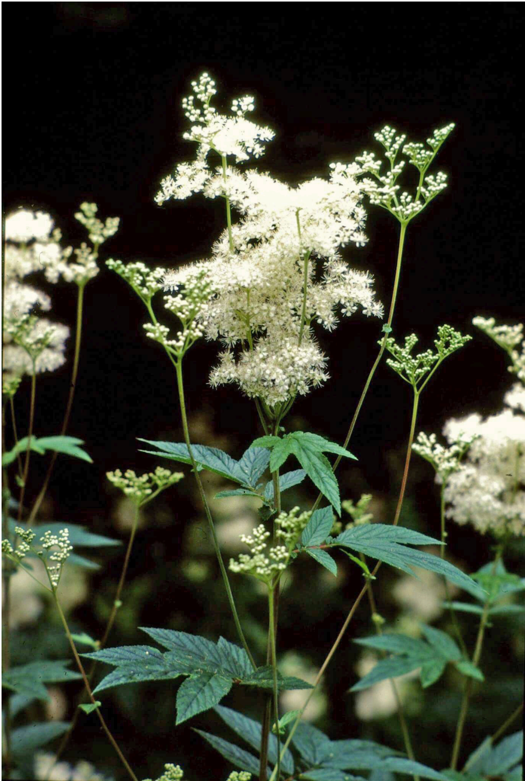
Mjødurt, Filipendula ulmaria , fotografert ved Kolsås i Bærum. Det tidligere latinske navnet Spiraea ulmaria ga inspirasjon til navnet aspirin. Mjødurt inneholder salisylater.