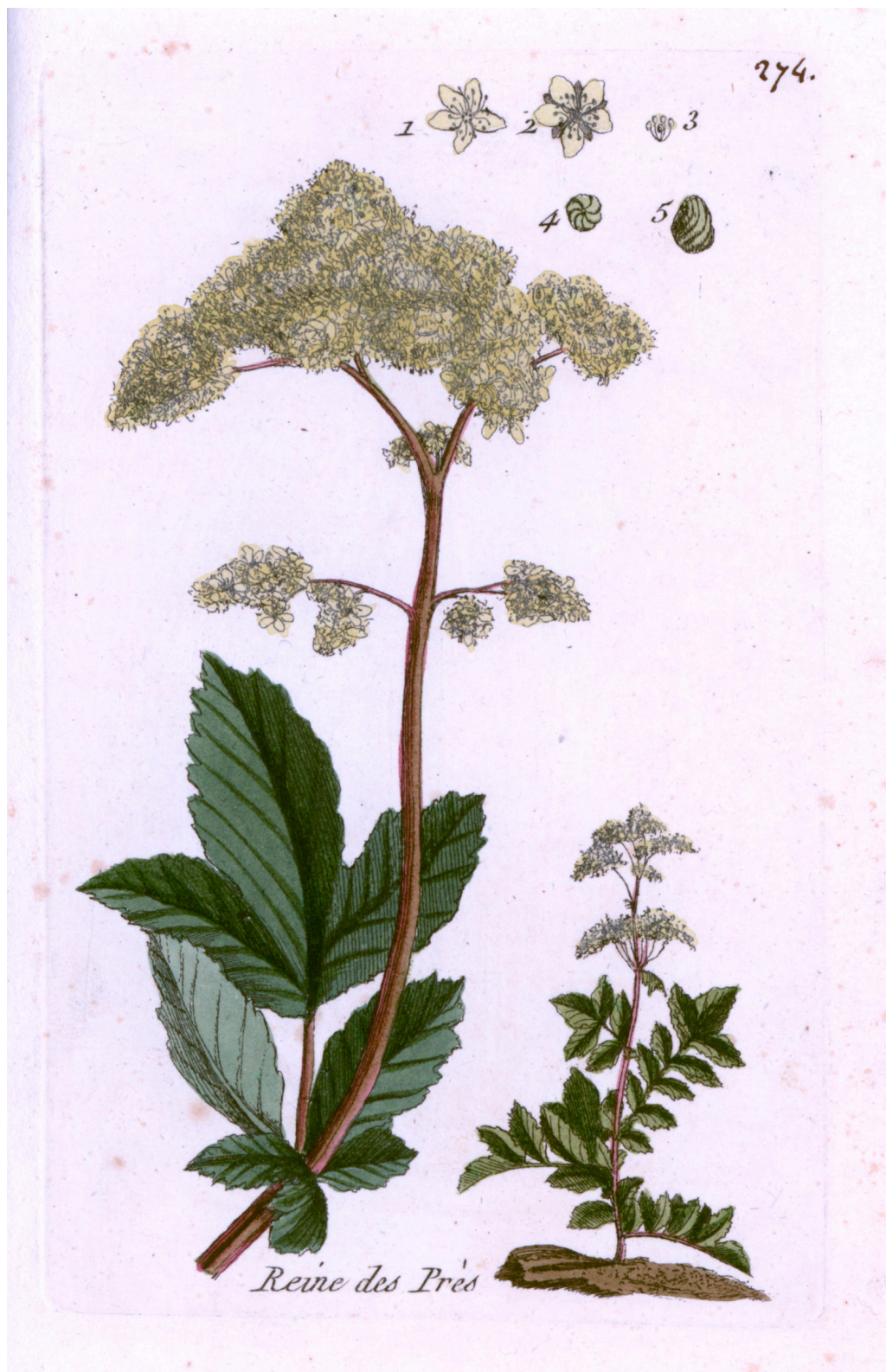
Mjødurt, Filipendula ulmaria , fransk «engdronning». Håndkolorert gravering av Pierre Bulliard fra «Flora Parisiensis», 1776.

Acetylsalisylsyre ble et av historiens mest fremgangsrike legemidler og er fortsatt en hjørnestein i antitrombotisk behandling. Som smertestillende medikament har det imidlertid mistet sin betydning og er blitt erstattet av nyere NSAID-midler. I moderne postoperativ smertebehandling brukes gjerne COX-2-selektive hemmere, som kan betraktes som den yngste arvtageren til pilebarken (23).