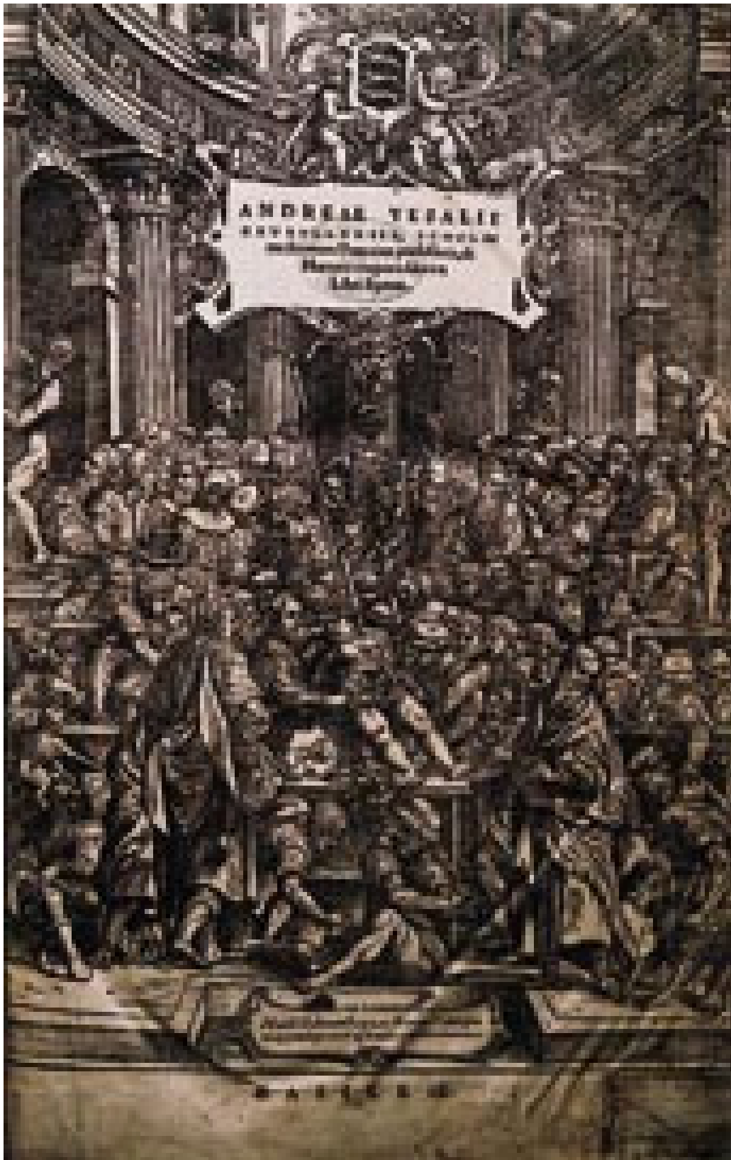
Figur 1