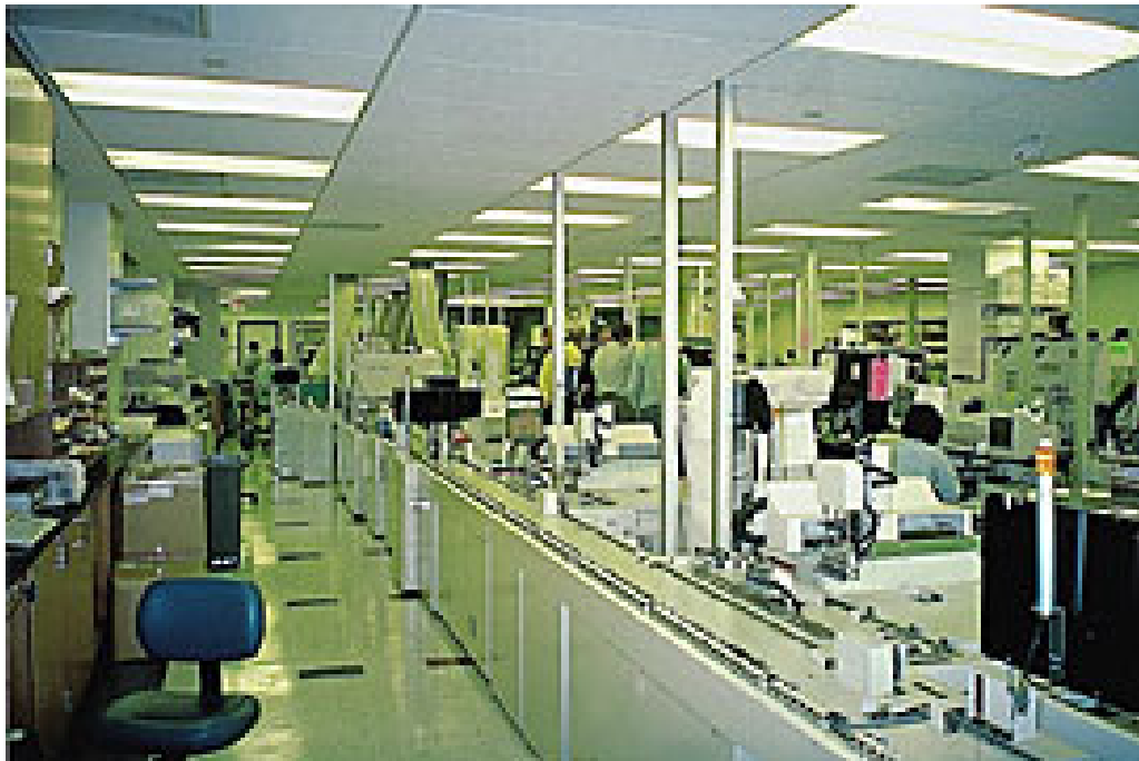
Figur 4 Utsnitt av transportbåndet fra kjernelaboratoriet ved Department of Pathology and Laboratory Medicine, Hospital of the University of Pennsylvania, Philadelphia, USA. Analysemaskinene er plassert vinkelrett på transportbåndet, inn til høyre.

identifikasjon av prøver, robotiserte løsninger for prøveforflytting og datamaskiner for å styre og overvåke driften. Ved hjelp av dette kunne man til enhver tid identifisere en prøves lokalisasjon på transportbåndet.