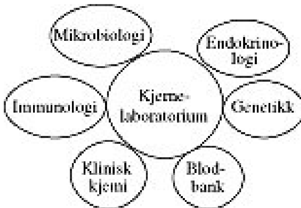
Figur 3 Modell av det integrerte laboratorium. Enheter for mikrobiologi, immunologi, klinisk kjemi, blodbank, genetikk og endokrinologi er lokalisert i tilknytning til et kjernelaboratorium. I kjernelaboratoriet undersøkes alle prøver der testene lar seg automatisere. I særlig grad vil dette gjelde prøver til klinisk kjemi og hematologi, men også endokrinologiske og serologiske prøver vil være aktuelle

Laboratoriene vi besøkte var i ferd med eller hadde nylig gjennomført endringer i organisasjonen etter ovenstående skisse. I kjernelaboratoriene analyserte man hovedsakelig klinisk-kjemiske og hematologiske prøver. Mikrobiologiske og immunologiske prøver var foreløpig holdt utenfor automatiseringen, men det var et uttalt ønske om at automatiserbare serologiske analyser også skulle innlemmes i kjernelaboratoriet. De organisatoriske endringene i disse laboratoriene var delvis initiert ut fra et politisk ønske om økonomiske nedskjæringer. Alle steder rapporterte man om motstand fra fagmiljøene mot reorganiseringen – utbrenthet blant personalet var enkelte steder et omfattende problem. Samtidig var det klart at man hadde faglige og økonomiske gevinster å hente ved en vellykket reorganisering – ved enkelte laboratorier mente de at de alt hadde klart å synliggjøre at universitetsoppgavene ikke var blitt skadelidende av omstruktureringen.