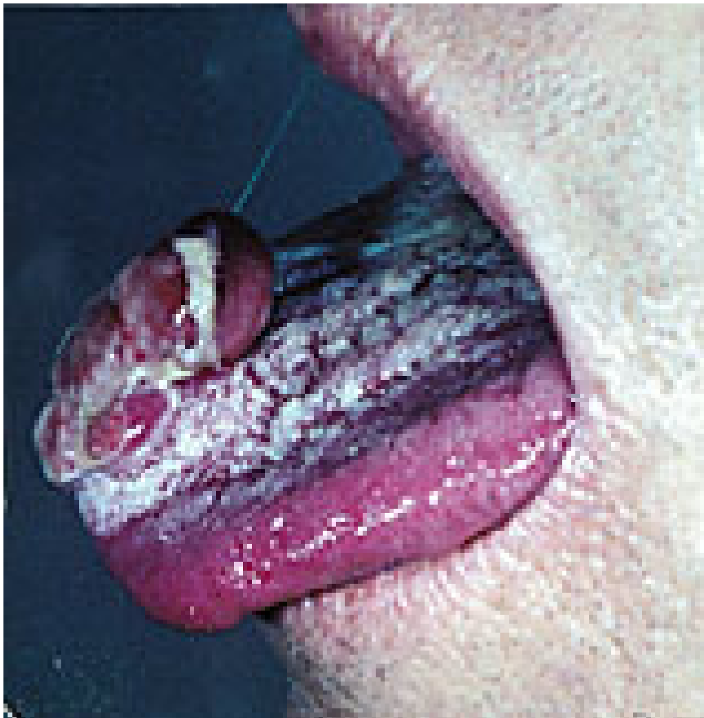
Figur 1 Ulcererende metastase i tungen fra nyrecellekreft

Hos pasienter med solitær hjernemetastase eller hos pasienter med tverrsnittsproblematikk på grunn av medullakompresjon bør nevrokirurgi vurderes hvis pasienten er i god allmenntilstand og har en forventet levetid \geq 6 måneder. Hos slike pasienter bør denne type kirurgi utføres selv om det foreligger spredning til flere organsystemer. Pasienter med store osteolytiske beinmetastaser bør vurderes av ortoped med erfaring i metastasekirurgi. Marg- eller platenagling eller andre stabiliserende prosedyrer er ofte effektive palliative tiltak og kan forebygge patologiske frakturer. Man bør huske på at osteolytiske metastaser fra nyrecellekarsinom ofte har store og blodrike bløtdelskomponenter (fig 2).