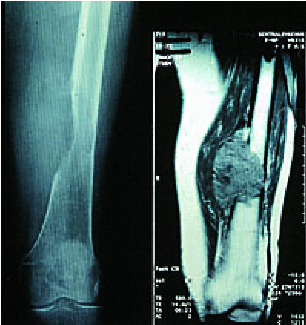
Figur 2 Osteolytisk metastase til humerus med stor bløtdelskomponent