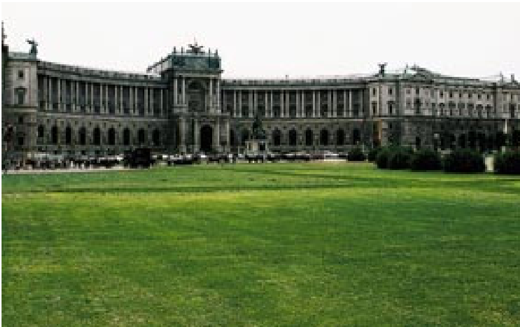
Figur 5 Konferanselokale og tidligere keisersete Hofburg, påbegynt i det 13. århundre

Under Leopold I (1658 – 1705) ble byen Europas sentrum innen musikk og teaterliv, men den virkelige gullalderen var likevel 1800-tallet. Den dag i dag er byen sterkt preget av bygninger fra denne perioden. Også de mange og store parkene ble etablert da, det var områder som tidligere hadde fungert som forsvarsanlegg. I 1910 var befolkningstallet på sitt største, to millioner, og bare London, Paris og Berlin var større i Europa. Før den første verdenskrig var Wien hovedstad i et rike med 52 millioner innbyggere og et areal på 1,2 millioner kvadratkilometer, etter krigen hadde Østerrike seks millioner innbyggere fordelt på 140 000 kvadratkilometer. En svær depresjon fulgte, dernest en tilnærming først til Mussolinis Italia og etter hvert tilknytning til Tyskland (Anschluss) i 1938. Østerrike var delt inn i fire soner etter den annen verdenskrig og ble ikke selvstendig igjen før i 1955 (5).