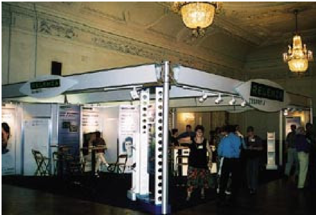
Figur 3 Influensa er viktig for allmennleger!