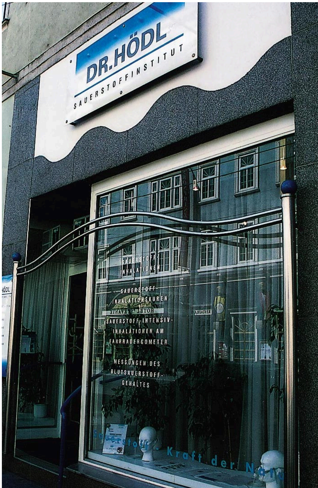
Figur 4 Ifølge vindusteksten gir Dr. Hödl ”Sauerstoff-inhalationskuren”, ”Sauerstoff-intensiv-inhalationen am Fahrradergometer” og ”Messungen des Blutsauerstoffgehaltes”