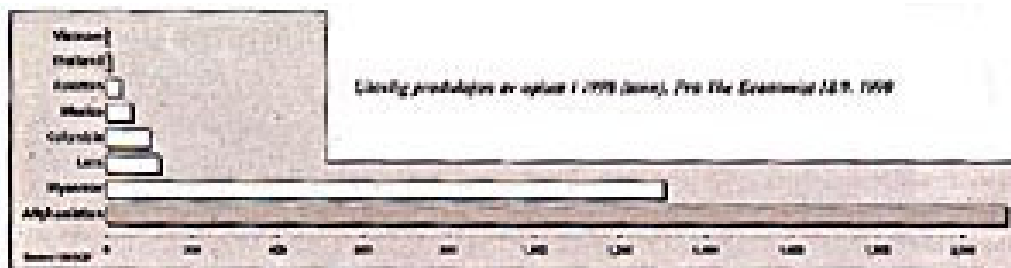
Ulovlig produksjon av opium i 1998 (tonn). Fra The Economist 18.9. 1999