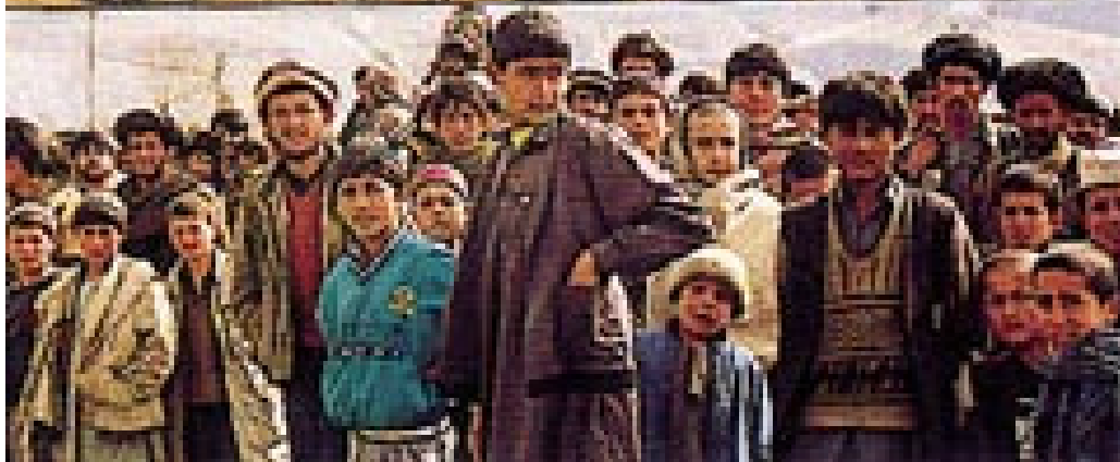
Landsbyene i Nord-Afghanistan klorer seg fast til fjellsiden. Nederst en del av de mange nysgjerrige fremmøtte afghanerne.