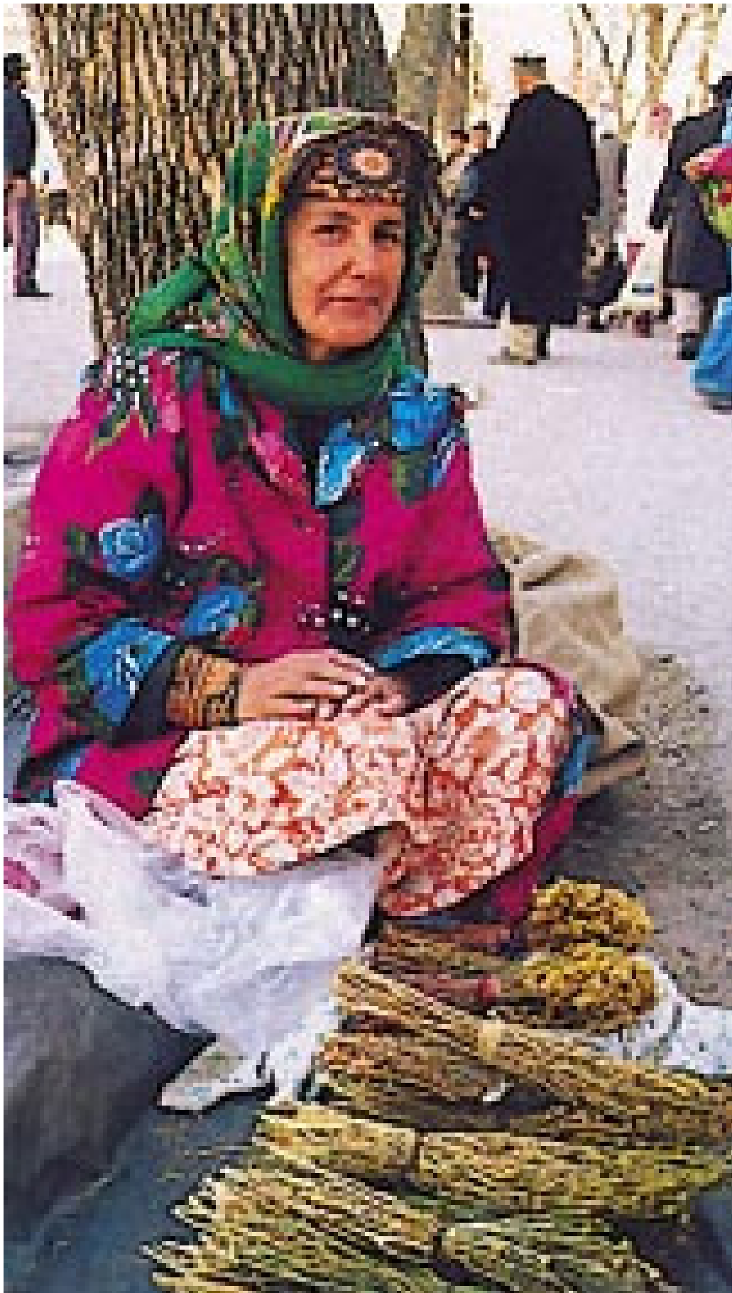
En kvinne selger helbredende urter på gaten. Tadsjikistan har en stor rikdom av slike urter, og helseministeriet oppmuntret til bruk av dem