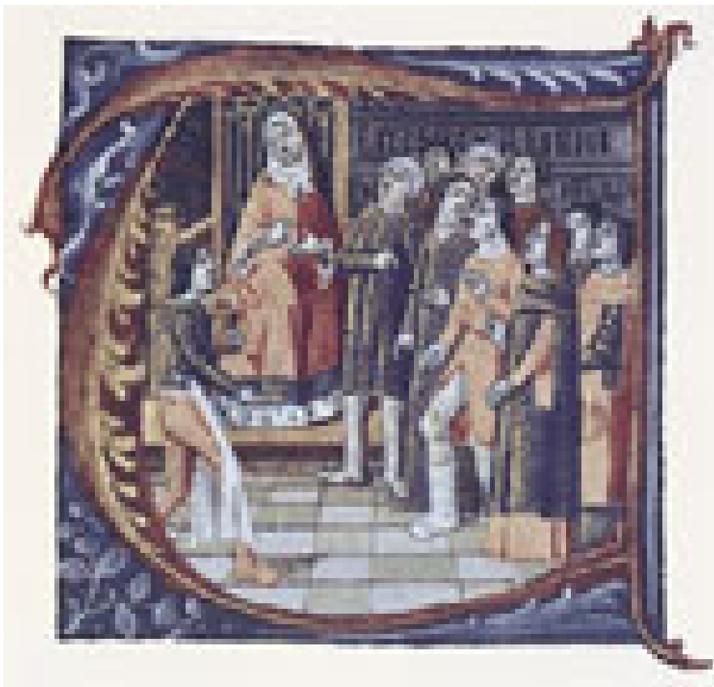
Galen ser på en pasient med sykdom i underekstremitetene (17)