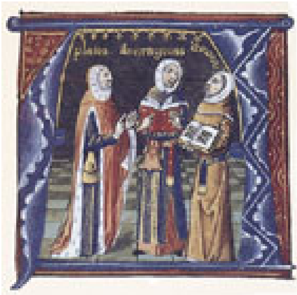
De tre filosofer Platon, Anaximander og Demokrit (17)

Hos Aristoteles (384 – 322 f.Kr.) ble Platons bestemmelse av kunst som etterligning utvidet til å være den ideelle virkelighet som er iboende til stede i tingen selv, selv om den er skjult for den daglige erkjennelse. Det som en kunstner skal «etterligne» (producere) blir synlig i verket (8). Den tilsynelatende virkelighet skaper en «illusjon», på samme måte som en illusjon har en virkelighet bak seg.