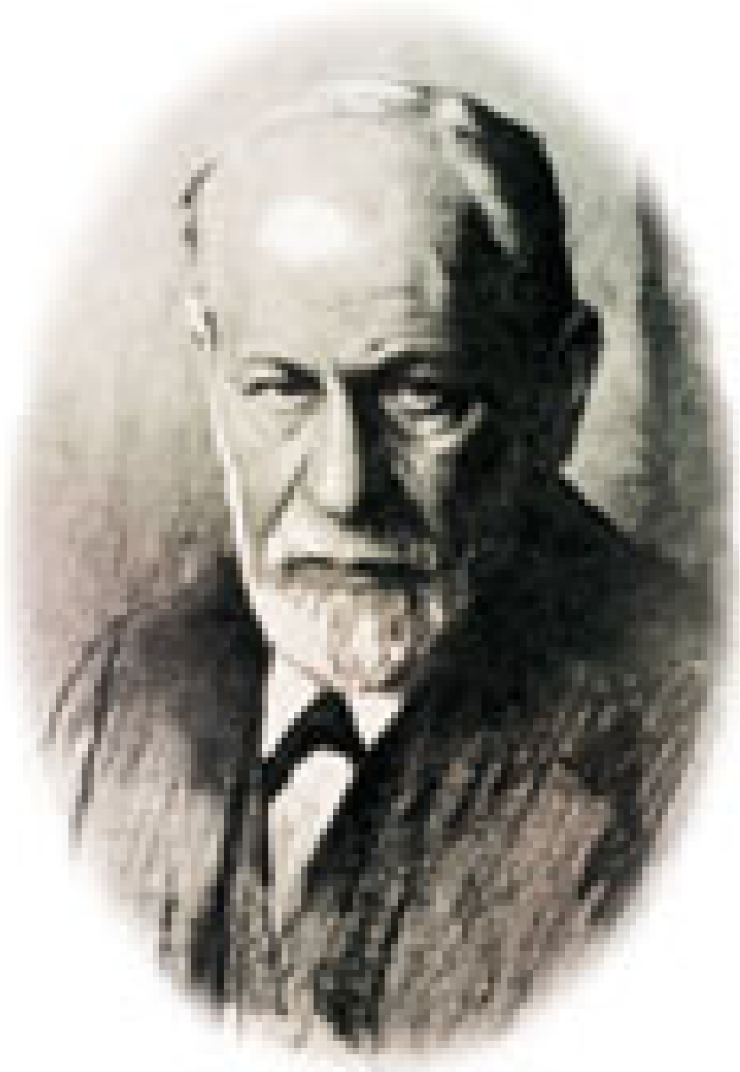
Kobberstikk av Sigmund Freud, utført av Ferdinand Schmutzer i 1926 (36)

var blitt utsatt for seksuelle overgrep i sin barndom. Disse traumatiske opplevelsene ble imidlertid spaltet fra bevisstheten, fortregt, og konvertert til somatiske symptomer som lammelser, kramper eller persepsjonsforstyrrelser (1).