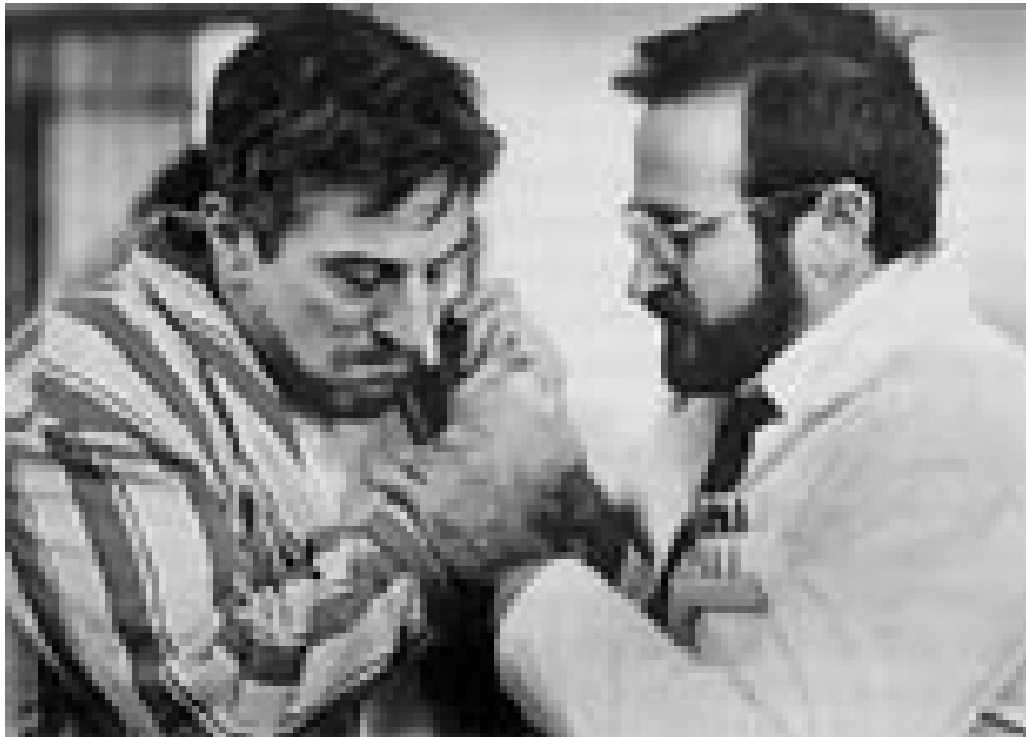
Fra filmen Oppvåkningen

Boken viser hvordan medisins vekst og fall avspeiler seg gjennom spillefilmer i siste halvdel av det 20. århundret. Her er mange spennende historier, men på bakgrunn av de store forventningene som tittelen skaper, blir det hele likevel litt skuffende. Det skyldes dels den særdeles amerikanske innfallsvinkelen og dels den deskriptive og til tider litt kjedelige formen. Men du verden så mange detaljer og så mye informasjon for alle som er interessert i legerollens utvikling – både på og utenfor lerretet.