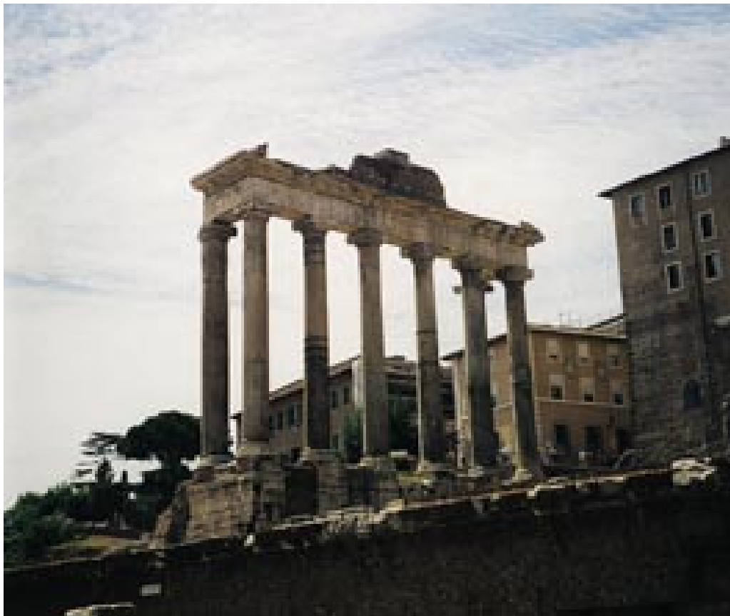
Figur 3 Saturns tempel på Forum Romanum