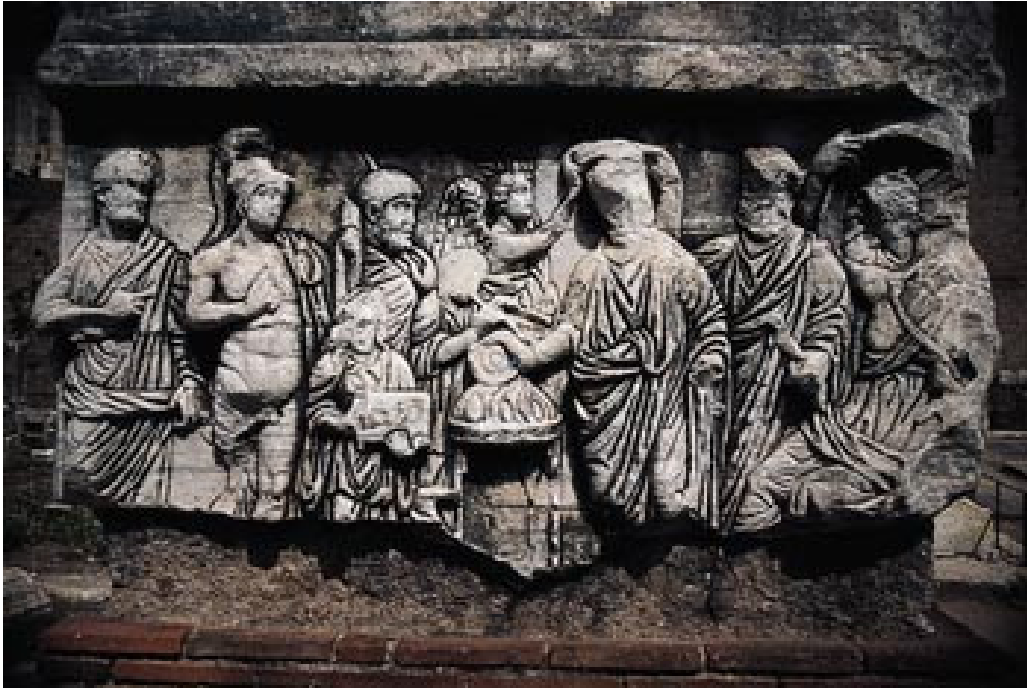
Figur 2 Decennialiebasen på Forum Romanum, med solguden avbildet helt til høyre

soldyrkelse (13). Tilbedelsen av Mitra var imidlertid forbeholdt menn, fortrinnsvis romerske soldater. Innvielsesseremonien var en viktig rituell handling innen denne orientale religion idet bare den som var innviet kunne delta i de kultiske handlinger. Liknende forbehold skulle senere også gjelde for den kristne kult. Bare den som var døpt og hadde deltatt i nattverden, kunne betraktes som innviet. Mens man i Mitras-kulturen ble overrislet med blod fra offerdyr, fikk de kristne dåpsvann over hodet. Dessuten drakk de "Kristi blod" under nattverden. Ikke nok med at de to kulturer konkurrerte på det rituelle og seremonielle plan. Både Mitra og Kristus gjorde krav på 25. desember som sine respektive fødselsdager.