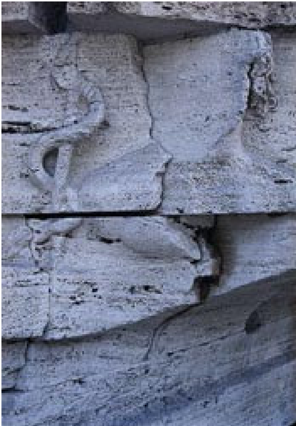
Figur 1 Relieff som viser Asklepios. Fra Tiberøya (Isola Tiberina) i Roma.