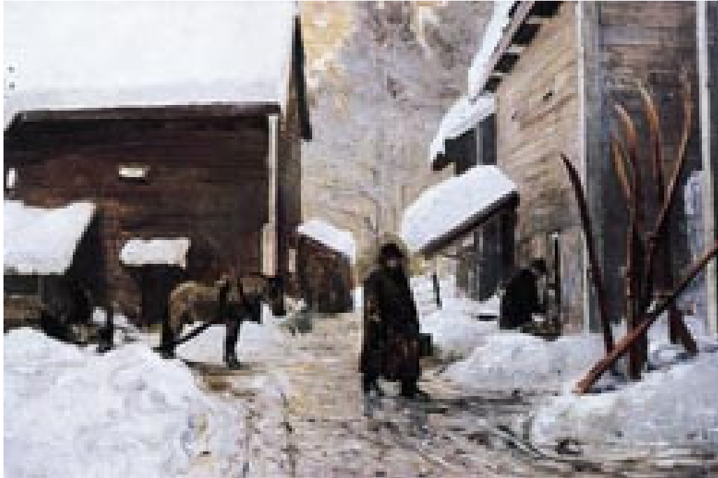
Figur 1 Gerhard Munthe (1849 – 1929): Doktoren vender hjem. 1888. Privat eie

I 1995 ble det, i samarbeid med Trondhjems kunstforening og Nidaroskongressen i Trondheim, arrangert en kunstutstilling, Pasienten og legen (6), som ble omfattet med stor interesse. Egentlig dannet vel denne utstillingen grunnlaget for de senere kurs for studenter og leger.