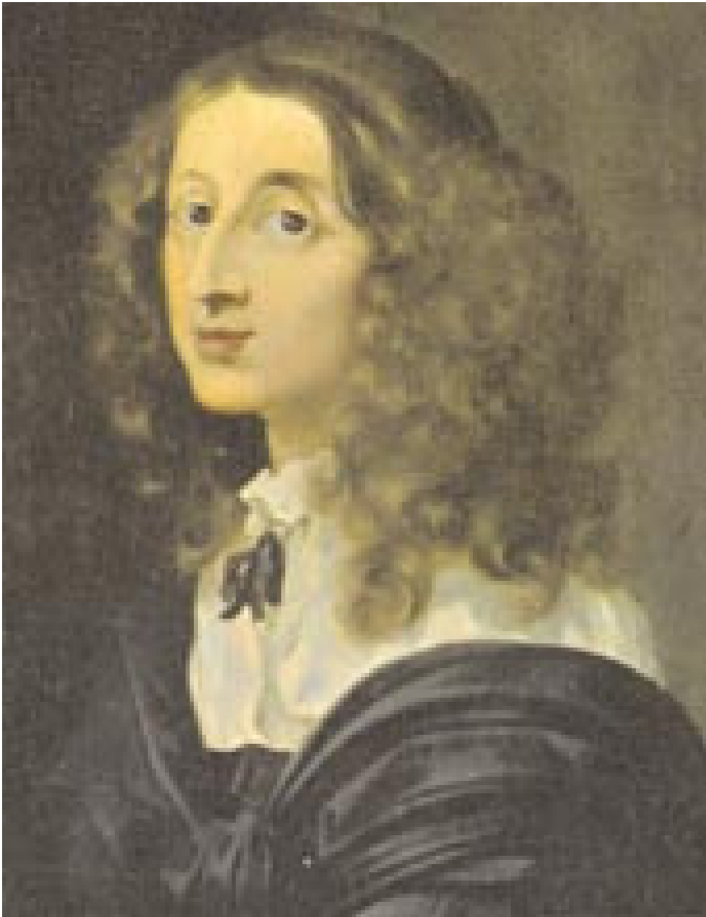
Dronning Christina (1626 – 89)

Den lesende lege kan av og til oppleve overraskelser. Svenskene vant trettiårskrigen for protestantene i Europa. Seierherrens datter, Christina av Sverige (1626 – 1689), abdiserte, konverterte til katolisismen og flyttet til Roma. En større politisk skandale har vi ikke hatt i vår verdensdel i dette årtusen. Det er skrevet hyllemeter om årsaken til dette: Manglende evne til å regjere, sterk religiøs katolsk vekkelse, homoseksualitet – og endelig Hollywoods versjon med Greta Garbos forelskelse i en utenlandsk diplomat. Ingen av årsakene er helt troverdige. Stor blir overraskelsen når vi leser hennes beretning om sin fødsel i utkastet til selvbiografi: ”Jag föddes med segerhufva, var helt luden och hade en grof och stark rost, hwilket alt inbillade barnmorskorne, at jag war en gosse” (12). Kongen fikk beskjed om at en prins var født – dronningen hadde