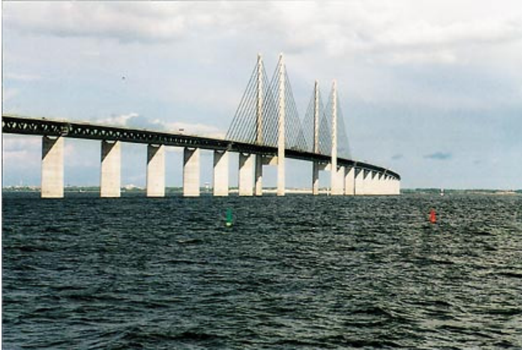
Øresundsbron er den nye fastlandsforbindelsen mellom Sverige og Danmark og symbolet på samarbeidsviljen i regionen.

Et av de mest ambisiøse satsingsområdene er medisinsk bioteknologi. De siste årene har mer enn 120 små og store industriselskaper innen dette området gått sammen med offentlige universiteter, forskningsinstitusjoner og sykehus i det EU-støttede regionaliseringsprosjektet Medicon Valley (se side 2069).