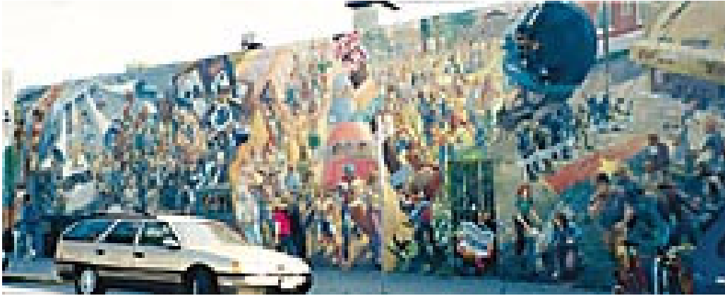
People's Park med malerier fra hendelsene i 1968 og senere

som var påkrevd fra gang til gang. Studentene må følge 3 – 4 slike kurs hvert semester for å få full uttelling. Hvordan de klarer det, fatter ikke jeg. Flinke er de også. Kanskje ikke så rart, siden Berkeley er et vanskelig universitet å komme inn på. Alle deltar meget aktivt i diskusjonene, på en måte som jeg synes vi sjelden opplever hjemme, og de skriver 3 – 4 ”papers” av meget høy standard til hvert eneste kurs de tar. Én ting er jeg i hvert fall blitt overbevist om, og det er at norske studenter (både medisinere og samfunnsvitere) får altfor lite øvelse i å skrive.